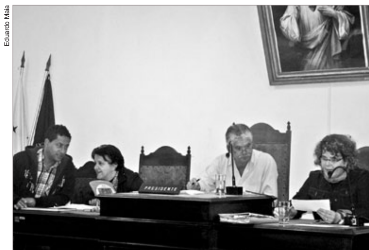
Câmara apura falta do medicamento nas unidades de saúde

A disponibilidade do produto é fundamental à política de assistência primária à saúde. Para a vereadora