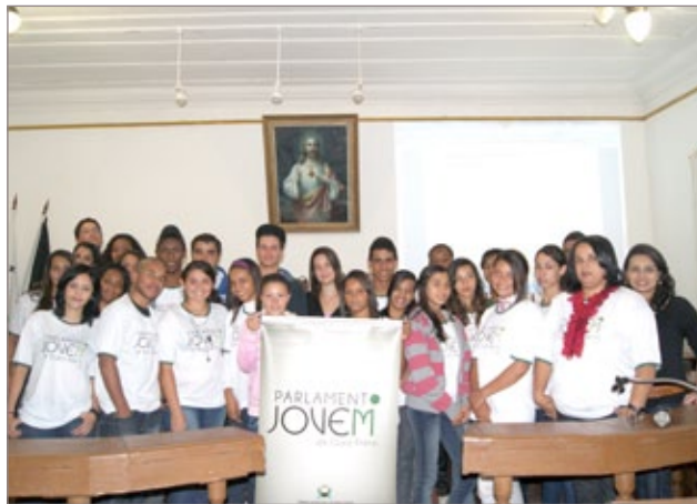
Integrantes do Parlamento Jovem de Ouro Preto 2012 durante a Plenária Municipal realizada na Câmara no final de maio

O Parlamento Jovem de Ouro Preto é uma ação da Câmara Municipal em parceria com a Escola do Legislativo da ALMG, e com o Núcleo de Direitos Humanos da Universidade Federal de Ouro Preto (Ufop).