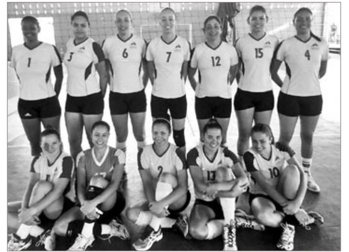
Equipe se classificou para a última etapa da competição, que acontece em novembro