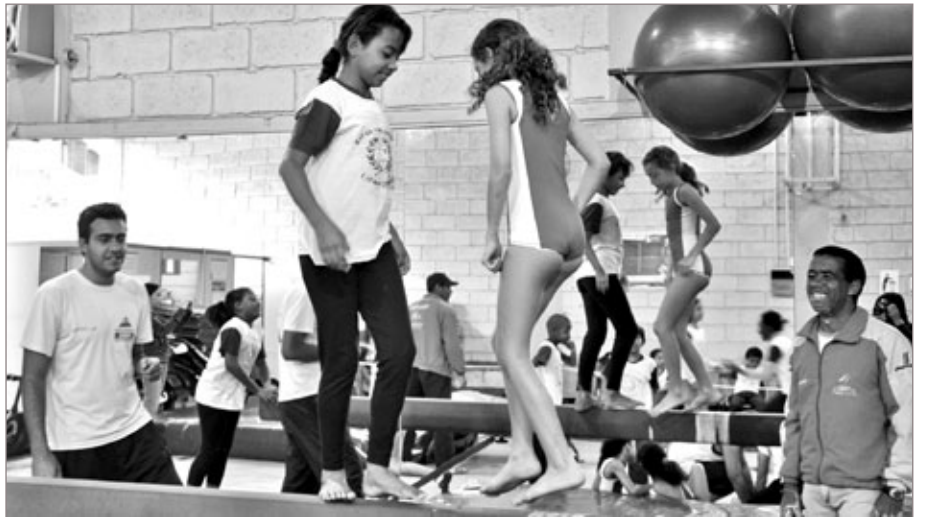
Atletas do Núcleo ajudaram os alunos da escola municipal Laura Queiroz nas atividades