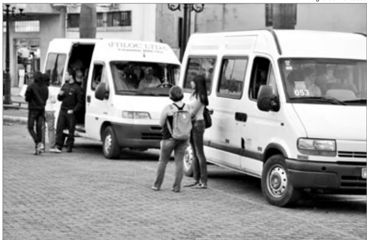
Transporte gratuito atende mais de mil estudantes de Itabirito