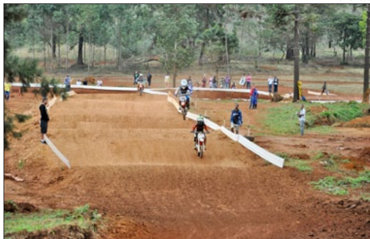
Mais de 300 pilotos mostraram as melhores técnicas e manobras