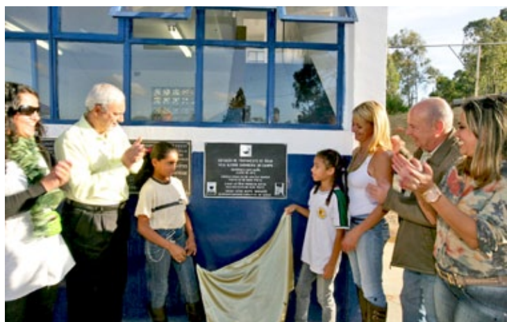
Prefeitura de Ouro Preto entrega Estação de Tratamento de Água da Vila Alegre em Cachoeira do Campo

Em breve, será inaugurada a Estação de Tratamento de Água de Amarantina. Além disso, a Prefeitura e o Semae estão investindo nas redes de esgoto e distribuição de água potável na localidade do Mota, em Miguel Burnier. "Qualidade de vida, água tratada e distribuída para toda a população e tratamento de esgotos são metas importantes do nosso governo que estão chegando a bom termo, graças aos investimentos que realizamos recentemente", lembra o prefeito.