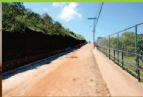
Ladeira João de Paiva