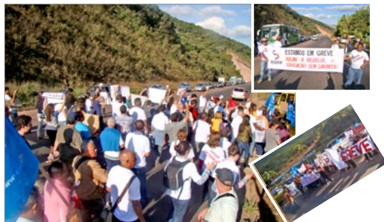
Movimento das universidades federais fecha a BR-356 em Ouro Preto, e pressiona reitores a apoiarem reivindicações

Em acordo com a Polícia Militar Rodoviária, por volta das 15 horas os manifestantes fecharam a via nos dois sentidos, por aproximadamente 15 minutos. O protesto contou com a participação de cerca de 450 representantes das Universidades de Ouro Preto (Ufop), Minas Gerais (Ufmg), Lavras (Ufla), São João del-Rei (UFSJ), Juiz de Fora (UFJF), Rural do Rio de Janeiro (UFRRJ), Fluminense (UFF) e dos sindicatos Adufop, Sinasefe (IFMG), Sindifes (Instituições Federais de Ensino). Uma comissão representada pelos três segmentos – alunos, técnicos e professores – entregou uma “Carta Aberta à Andifes”, cobrando um maior compromisso da Andifes quando às principais reivindicações do movimento. Já na terça-feira, 26, os reitores receberam os representan-