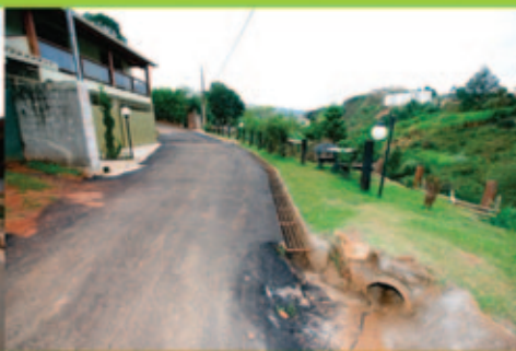
Rua Jorge Caram