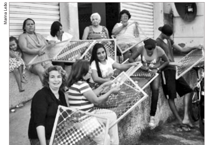
Peças expostas foram confeccionadas pelos integrantes do Grupo Independente das Mulheres Rendeiras de Maceió

As peças expostas foram confeccionadas pelos 38 integrantes do Grupo Independente das Mulheres Rendeiras de Maceió, usando as seguintes técnicas: filé, rechiliê, rendendê, labirinto, caicó, crivo, fibra de coco e renascença. “Em Maceió, o artesanato é fonte de renda para muita gente. A proposta dessa exposição é criar uma alternativa de trabalho para a baixa temporada”, afirmou Geraldo Nogueira,