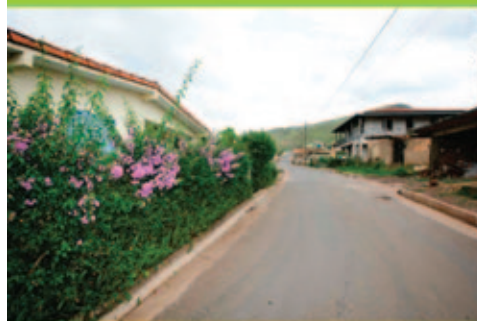
Rua Eli Coelho Neto