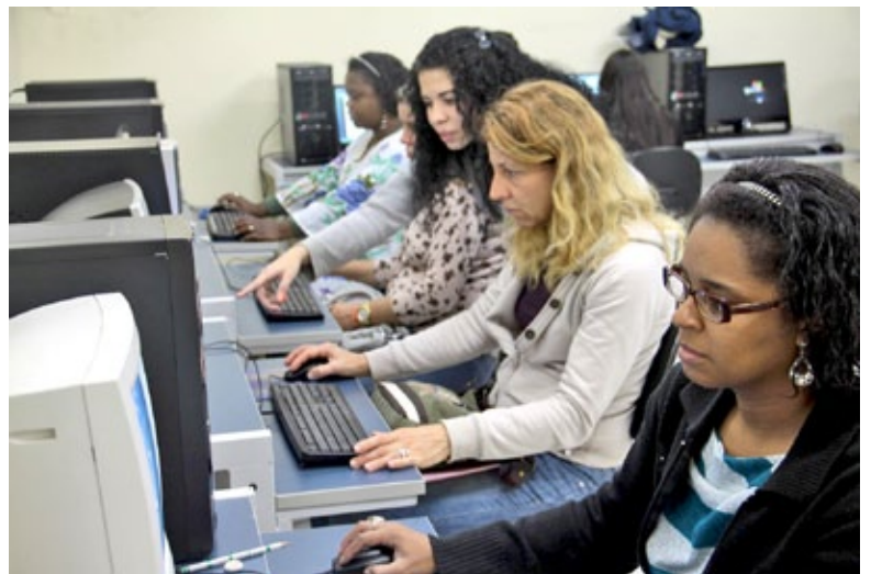
Professores participam de oficina do Projeto Local, Digital, Global

De 26 a 28 de setembro, Mariana e Ouro Preto receberão o I Encontro Local, Digital, Global: letramentos dentro e fora da escola. Promovido pelo Instituto Federal Minas Gerais - Campus Ouro Preto, o evento propiciará discussões sobre possibilidades pedagógicas mediadas pelas tecnologias digitais, para, dessa forma, buscar alternativas de ensino e de aprendizagem.