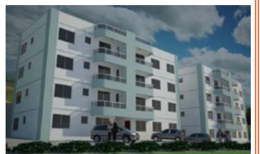
Nossa Senhora do Carmo