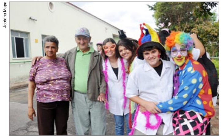
Doutores da alegria participaram da visita à Casa de Repouso Santa Luiza de Marillac