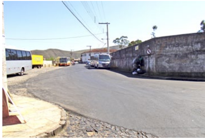
Travessa Cristo Rei

A área que abrange a rua Dr. Furtado Menezes, a travessa Cristo Rei e o início da Rua irmãos Ken-