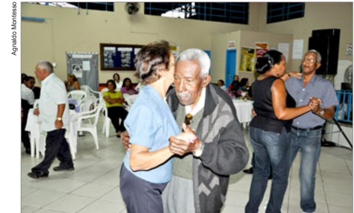
Programação foi encerrada com um jantar dançante na sede do Clumi

da. No dia 25, foram oferecidos serviços gratuitos como aferição de pressão arterial, corte de cabelo e cuidado com as unhas, no campo do Itabirense Esporte Clube.