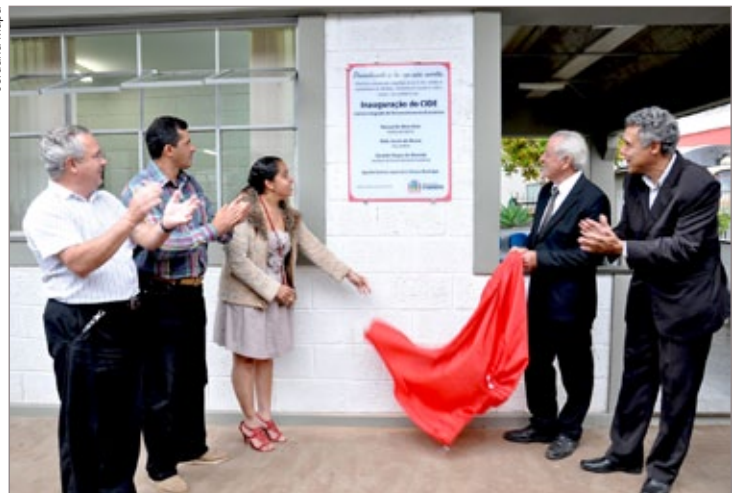
Autoridades fizeram o descerramento da placa de inauguração da sede do Cide