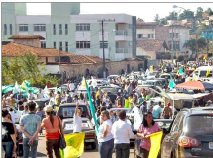
Carreata ficou lotada e atingiu uma marca histórica