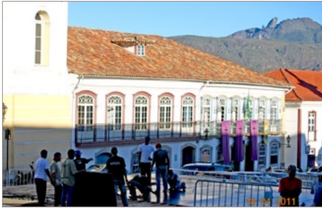
A mansarda do IPHAN na Praça Tiradentes. “Mansardas descaracterizam a cidade”?