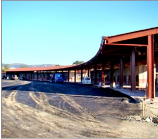
Rodoviária Cachoeira do Campo