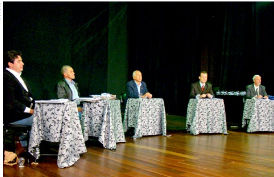
Candidatos a prefeito travaram debate no Auditório do IFMG