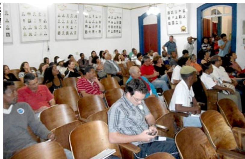
Sob pressão popular, Câmara aprova aumentos salariais

Ainda na mesma sessão, aprovou-se o Projeto de Lei 68/2012, de autoria da Casa e solicitado pelo executivo, que garantiu aumento de 13% para o próximo prefeito (R$ 18.900) e vice-prefeito (R$ 12.900), e 16% para o futuro secretariado (R$ 9.900). Os vereadores aprovaram os reajustes no apagar das luzes da campanha eleitoral, tendo em vista que a legislação estipula que os parlamentares somente