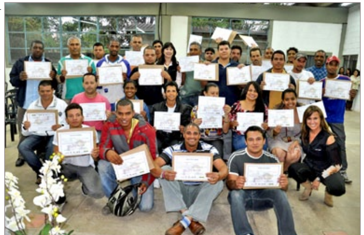
Formandos dos cursos oferecidos pelo Sest-Senat, em parceria com a Prefeitura, já no Cide