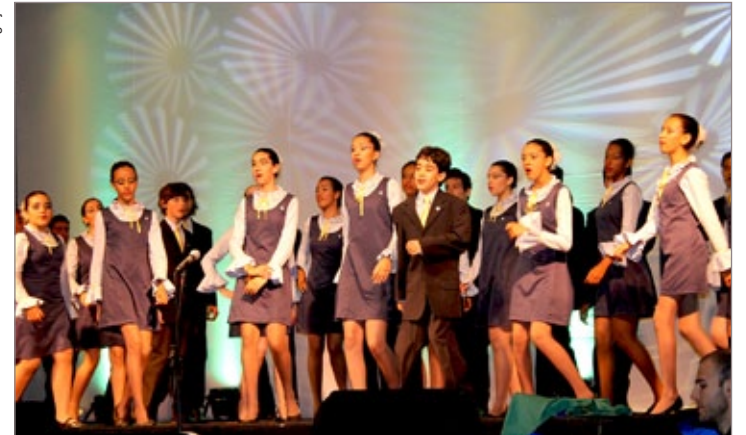
Apresentação fez parte das comemorações do aniversário de Itabirito