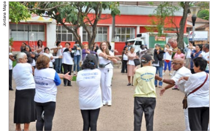
Caminhada foi a primeira atividade da Semana do Idoso