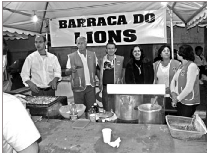
No último fim de semana, 28 a 30 de setembro, o distrito de Cachoeira do Campo esteve em alegria com a tradicional Festa da Jabuticaba. O Lions Clube agradece a todos pela beleza e sucesso da festividade.