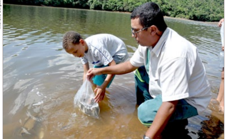
Funcionários da Cemig auxiliaram na soltura dos peixes