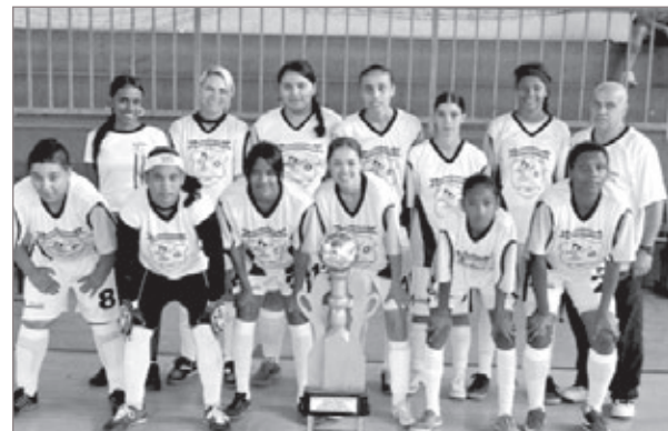
Equipe de futsal de Itabirito é destaque nas competições femininas pelo Estado