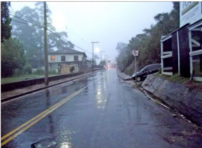
À esquerda, sede do Departamento de Limpeza da Prefeitura de Ouro Preto. O Departamento será transferido do local de acordo com orientações da Defesa Civil e do NAD