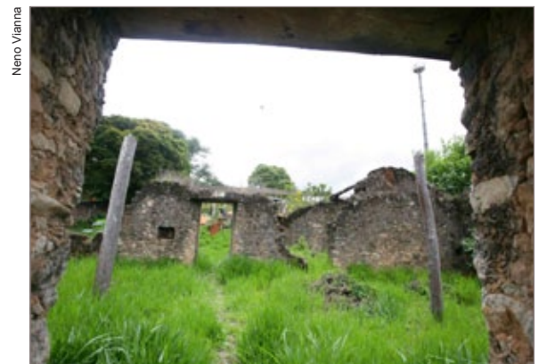
Anexo da Casa de Pedra onde funcionará Centro de Convivência Social, base e alvenaria já estão construídas