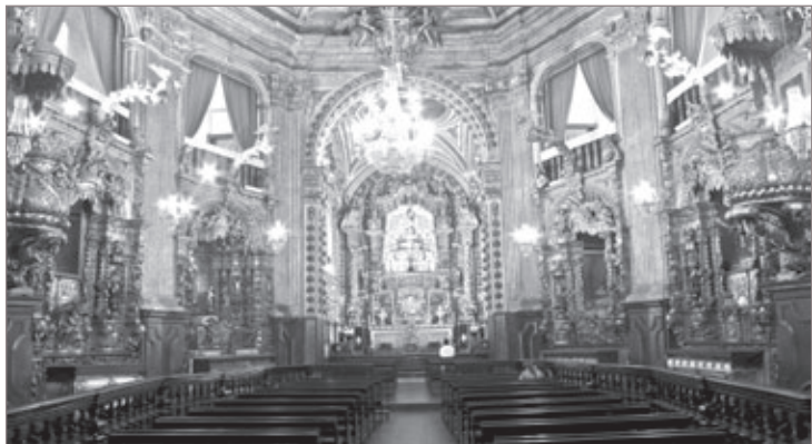
Neste sábado, 1º de dezembro, às 19h00, realiza-se a solenidade de Dedicção da Basílica Nossa Senhora do Pilar, em Ouro Preto. O ato principal, ou seja, Solene Missa Cantada, será conduzida pelo arcebispo, Dom Geraldo Lyrio Rocha, acolitado por demais párocos e sacerdotes da região.

Teve início, ontem, 29 de novembro, na Paróquia Nossa Senhora da Conceição, a novena preparatória para o XXXV Jubileu da Imaculada Conceição, no bairro Antônio Dias. Antecedida por outros ofícios religiosos, ao longo de cada dia, a novena será rezada sempre às 20h15, até 7 de dezembro no Santuário de Nossa Senhora da Conceição. No dia 8 de dezembro, feriado municipal, haverá missas com intenções diversas às 5h30, 7h30, 10h00, 14h00 e 16h00. Após esta última, procissão com a imagem da padroeira por todo o bairro, encerrando-se as comemorações com o Te Deum, à entrada da procissão. Dos internos participa com música o Coral e Orquestra São Pio X. Dos atos externos, participam a S. M. Senhor Bom Jesus de Matosinhos, a S. M. Senhor Bom Jesus das Flores, a S. M. União XV de Novembro / Mariana, e a S. M. Santa Cecília / Rodrigo Silva.