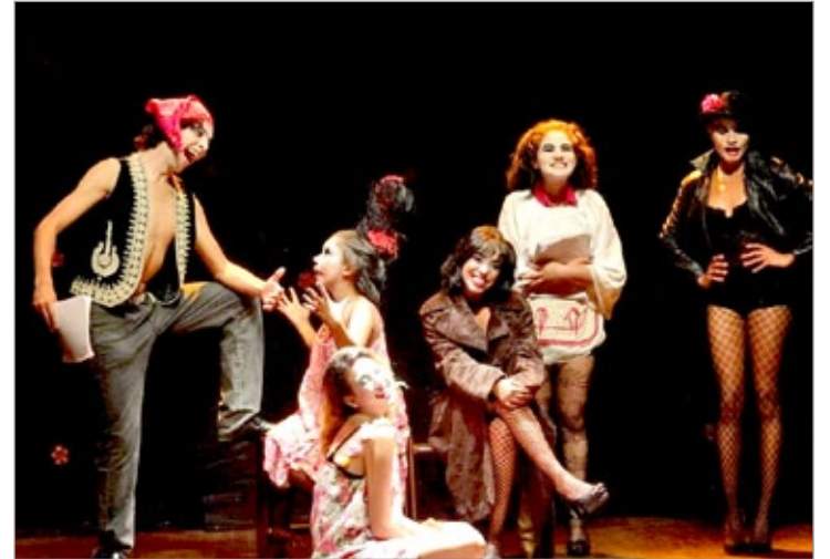
Cabareta é reapresentado neste domingo

Neste final de semana acontece mais uma apresentação do Domingo é Dia de Banda, em Itabirito. Nesta edição, o público confere os talentos da Corporação Musical Santa Cecília e da Banda da Polícia Militar, de Belo Horizonte. Você não pode perder este show, que acontece no Complexo Turístico da Estação, a partir das 10h.