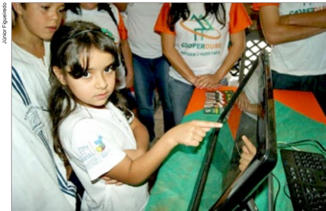
As crianças que visitaram o estande da Cooperouro participaram de um quiz virtual sobre Cooperativismo

No dia 24, funcionários da Cooperouro estiveram presentes na Feira Cultural da Escola Dom Velloso, levando descontração para as crianças. Um quiz virtual foi produzido para a garotada por em prática todos os seus conhecimentos sobre o cooperativismo. Por Allan Almeida