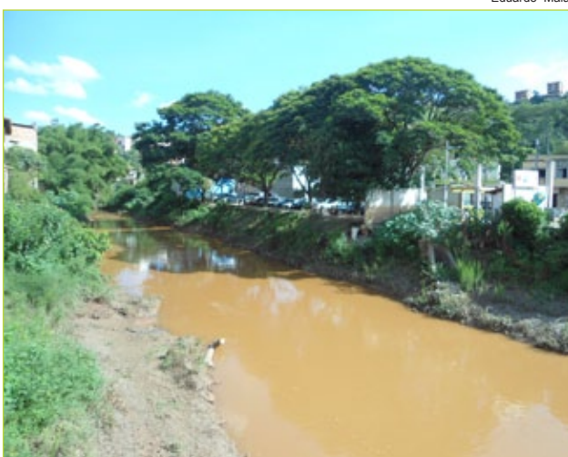
Limpeza e desassoreamento do rio contribuiriam para prevenir as enchentes em Itabirito

Secretaria de Meio Ambiente admite dificuldades para emplacar ação de limpeza do rio