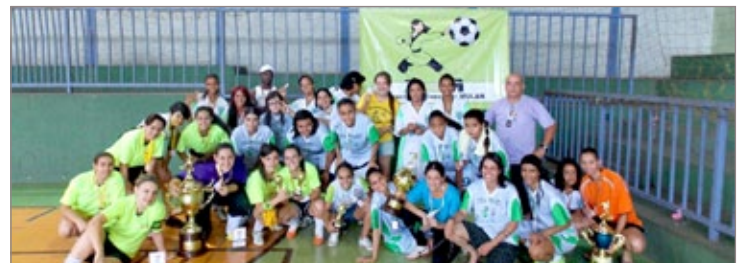
Este foi o primeiro realizado em Itabirito com apoio da Prefeitura