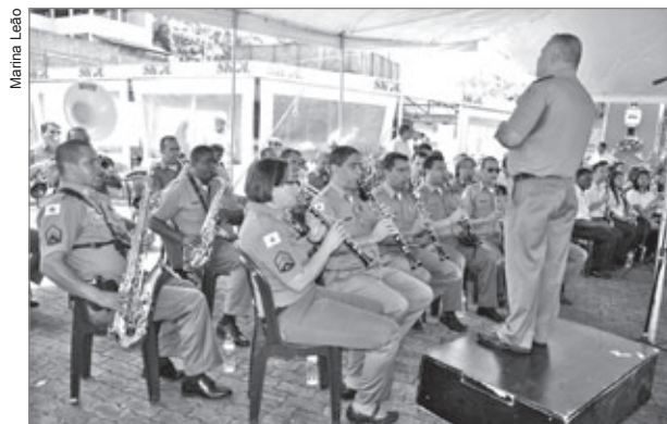
Banda da Polícia Militar de BH é uma das preferidas do público de Itabirito

Este foi o 9º ano do Domingo é Dia de Banda, que reúne os amantes da boa música sempre no último domingo de cada mês, no Complexo Turístico da Estação, com a presença de bandas da região e apresentações alternadas da Corporação Musical Santa Cecília e Corporação Musical União Itabiritense.