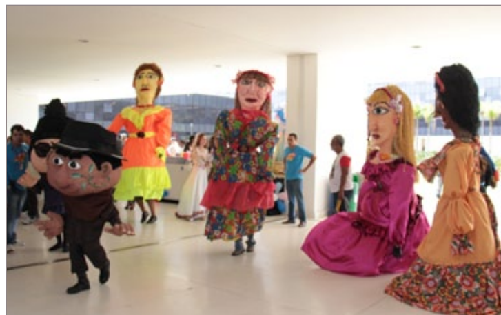
Bloco Zé Pereira dos Lacaiois faz apresentação na Cidade Administrativa

Para ambientar o evento, cada cidade ofereceu uma amostra de seu carnaval, com apresentação de alguns grupos. Ouro Preto levou o mais antigo bloco carnavalesco do Brasil, o Zé Pereira dos Lacaiois, que apresentou suas marchinhas junto aos tradicionais bonecos gigantes e recebeu muitos aplausos do público.