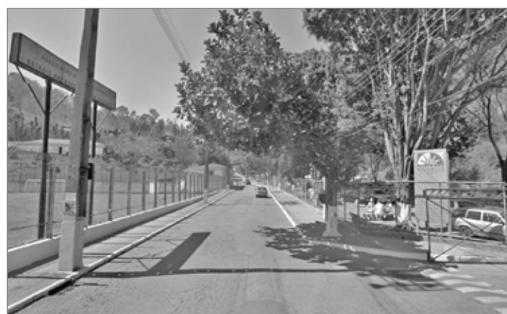
Rua Simão Lacerda irá sediar a Reunião da Câmara de Ouro Preto

A Reunião Ordinária acontecerá às 16h, e é aberta ao público.