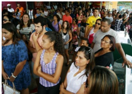
Os Chevrolet Ônix foram os prêmios mais desejados durante toda a Campanha