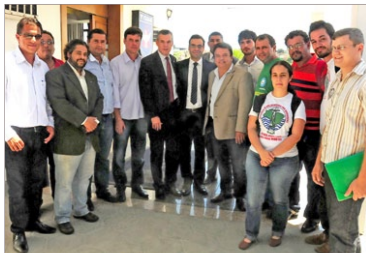
Presidente e Comissão Especial da Câmara de Ouro Preto em encontro com o Ministro Brizola Neto, autoridades estaduais, representantes sindicais e do Movimento dos Atingidos por Barragens (MAB)