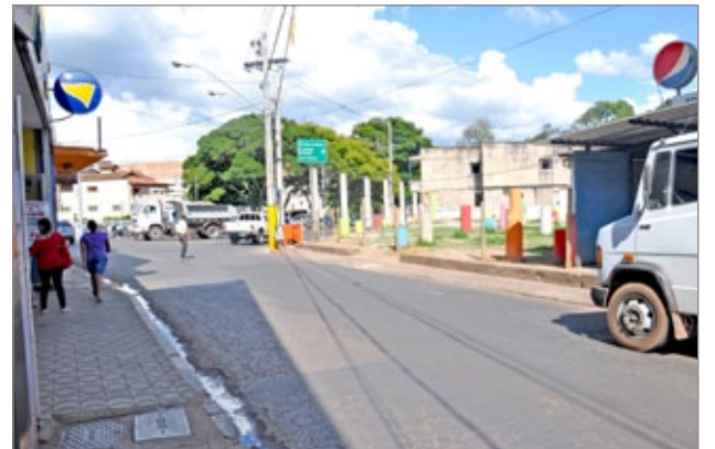
Ponto de ônibus será desativado na rua Dr. Guilherme

Para os motoristas que necessitam estacionar na região central há novidade na rua. Os rotativos voltam a ser obrigatórios a partir do dia 11 de março e o estacionamento será limitado ao lado direito das vias. Por meio da parceria com a CDL e SINCOVITA, os rotativos serão vendidos no comércio por R$ 1,00. Fiscais da Prefeitura farão a fiscalização e, em caso de descumprimento da determinação, a Polícia Militar será acionada. A multa por estacionamento em desacordo com a regulamentação tem o valor de R$ 53,20 e acumula três pontos na Carteira Nacional de Habilitação (CNH).