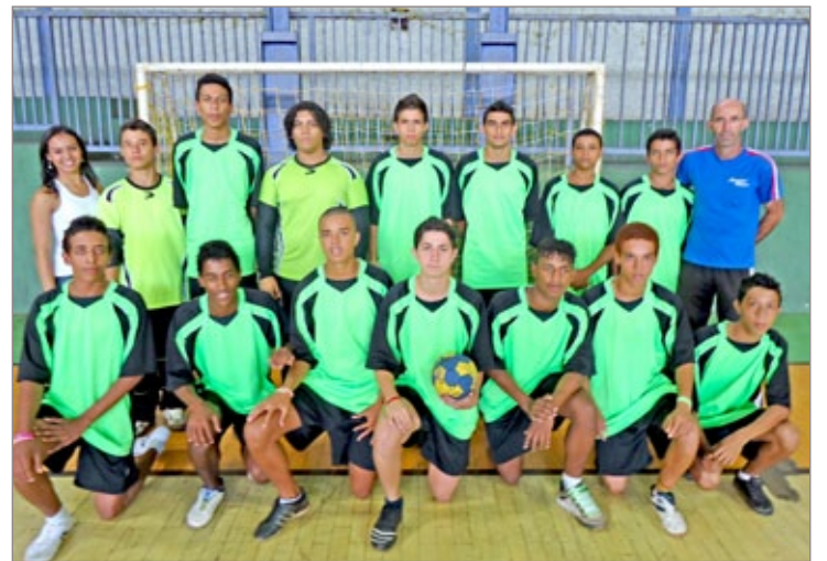
As equipes das escolas já estão preparadas para o JEMG

Além das tradicionais modalidades como o futsal, vôlei, handebol e basquete, este ano foi incluída a categoria mountain bike com competições de Down Hill e Cross Country. Em todas as modalidades há equipes masculinas e femininas. Para participar o atleta precisa ter entre 12 e 17 anos e estar matriculado em escolas do município. Além da premiação com troféus e medalhas, as equipes campeãs já garantem a participação na etapa microrregional do JEMG.