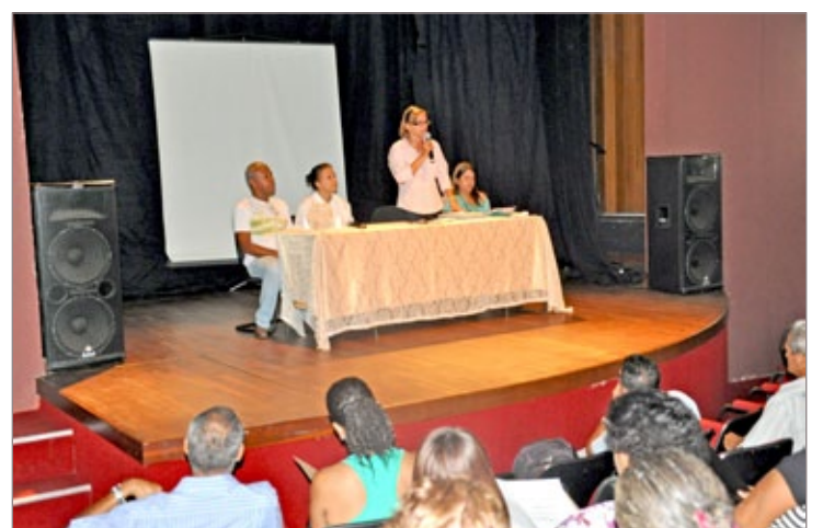
Equipe da Prefeitura realiza capacitação para associações comunitárias

que as associações tenham voz realmente ativa dentro da Prefeitura", comentou o prefeito Alex Salvador.