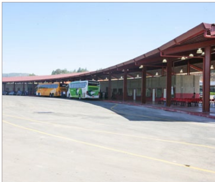
Terminal de Integração de Passageiros de Cachoeira do Campo

Guichê da empresa passa a funcionar a partir desta quarta-feira