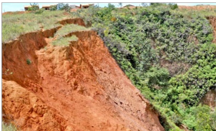
Mudança vai aumentar a distância entre as casas e a voçoroca