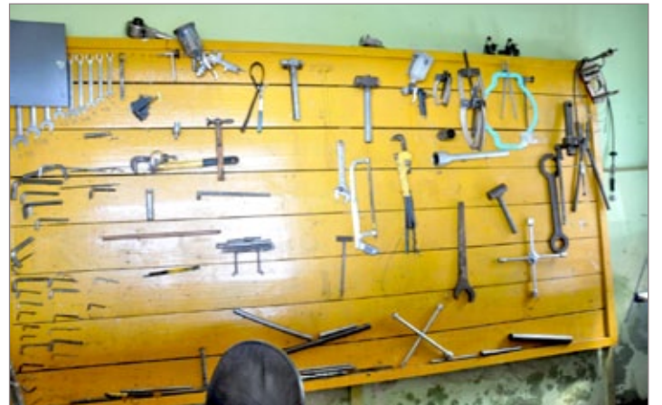
A ferramentaria foi encontrada toda desfalcada

tem se mobilizado para manter todos os serviços e garante que a situação vai melhorar. "Estamos correndo atrás de recursos federais e estaduais para adquirirmos uma nova frota. A população merece ser bem atendida". O prefeito ainda afirmou, "não vamos colocar a frota danificada em praça pública, como foi feito pela antiga gestão. Não trabalhamos dessa forma. Já basta para a população o péssimo estado de conservação que as praças foram deixadas".