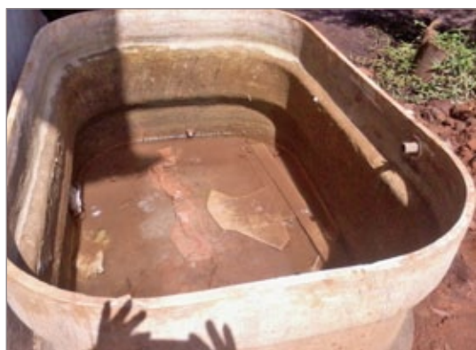
Mutirão contra a dengue encontra caixa d'água destampada em Antônio Pereira

A comunidade de Antônio Pereira recebe orientações em relação aos cuidados com a dengue. No distrito, somente este ano, foram constatados três casos autóctones da doença, ou seja, adquiridos no próprio local, além de um elevado número de larvas do Aedes aegypti.