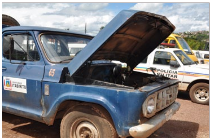
Foram encontrados vários carros sem motor e outros com motores fundidos