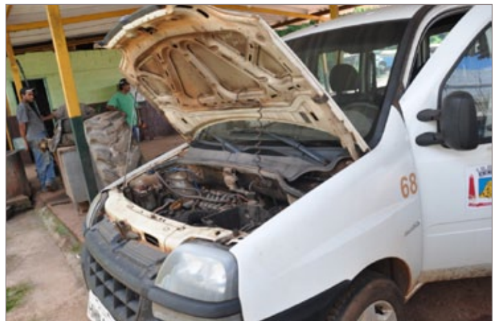
Foram deixados 25 carros estragados