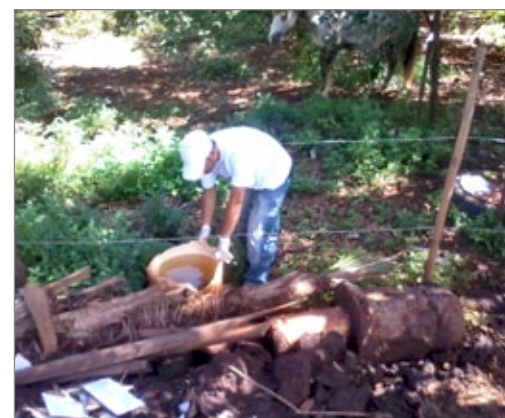
Mutirão da dengue elimina água parada

Os mutirões no distrito continuarão sendo realizados nos próximos sábados. Durante as semanas, são realizadas pesquisas, levantamentos e tratamentos focais. A equipe de endemia alerta a população sobre a importância da colaboração de cada um no combate a dengue.