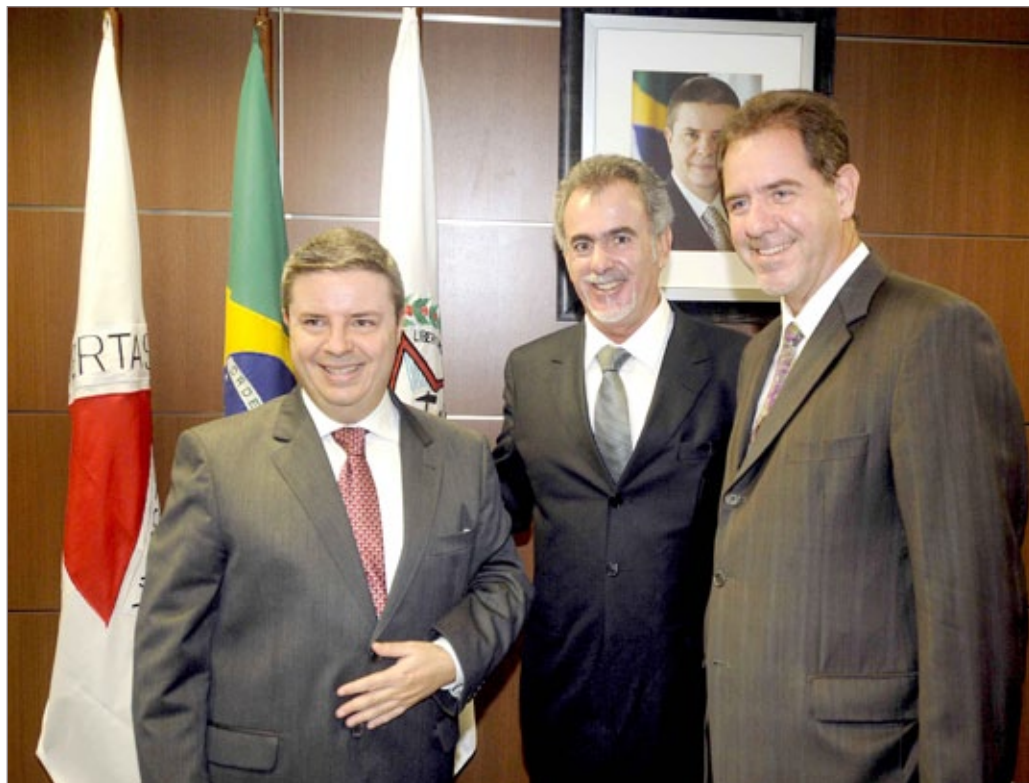
Governador Anastasia, prefeito Alex e consultor da Amig, Junho

No dia 11 de março, o prefeito Alex Salvador esteve na Cidade Administrativa, em Belo Horizonte, para um encontro com o governador Antônio Anastasia. Essa reunião teve como intuito retomar o diálogo com o governo estadual, já que nos últimos anos não havia nenhum relacionamento entre o município e o estado. Também foi uma oportunidade para o prefeito Alex reivindicar e buscar benefícios para a cidade. Além de solicitar mais recursos para o município, Alex falou dos grandes desafios da cidade, nessa nova gestão, como as obras que já estão sendo retomadas e da grande necessidade de revitalizar toda a cidade.