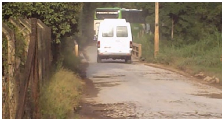
Ponte de Acesso a Amarantina

Já em Glaura, o vereador Wander e outros, requereu a construção de uma quadra poliesportiva ou reforma da atual, além de reforma e aplicação do posto de saúde do distrito. Solicitou também a manutenção da rede pluvial da localidade, construção de um posto policial, reforma e ampliação da escola municipal, melhorias na limpeza urbana, telefonia móvel, pavimentação da estrada que liga o distrito à localidade de Soares e calçamento da Rua do Cruzeiro.