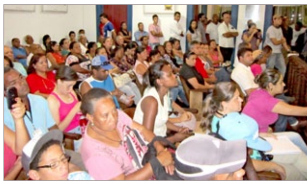
Plenário lotado de trabalhadores contra o projeto de lei 01/2013

A Vale Manganês S.A torna público que recebeu da Superintendência Central Metropolitana de Meio Ambiente e Desenvolvimento Sustentável - SUPRAM CM, através do Processo nº 00071/1987/006/2011, a prorrogação da Licença de Operação (certificado nº 032, em 26/02/2013), para o funcionamento da unidade de produção de ferro-ligas, localizada no município de Ouro Preto, no Estado de Minas Gerais, com validade até 26/02/2021, com condicionantes.