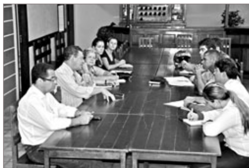
Reunião discute os abusos de volumes de sons em Itabirito

Foram decididas algumas ações. Uma delas é que será feita, pela Prefeitura, uma campanha educativa para tentar conscientizar pessoas de que o volume em exagero é um incômodo para a sociedade. Outra ação é intensificar o policiamento para coibir os abusos. “Devemos usar todos os recursos possíveis com ações policiais efetivas, com multas e até cassação de alvarás de alguns estabelecimentos comerciais para que o problema possa ser resolvido”, sugeriu o desembargador.