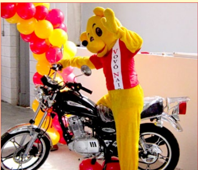
Moto será sorteada em breve para os clientes de Cachoeira do Campo e região