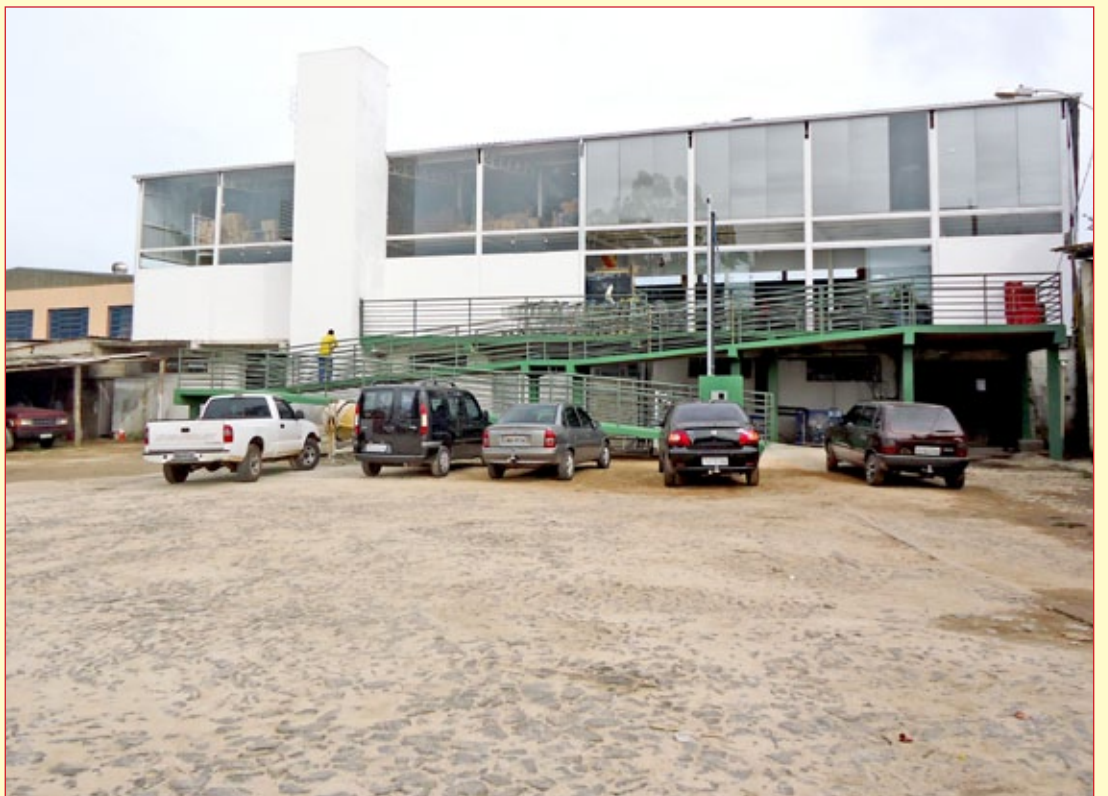
Novas instalações contam com amplo estacionamento e novo acesso