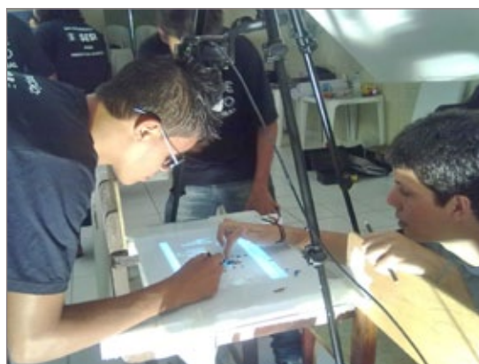
Oficina de Cinema