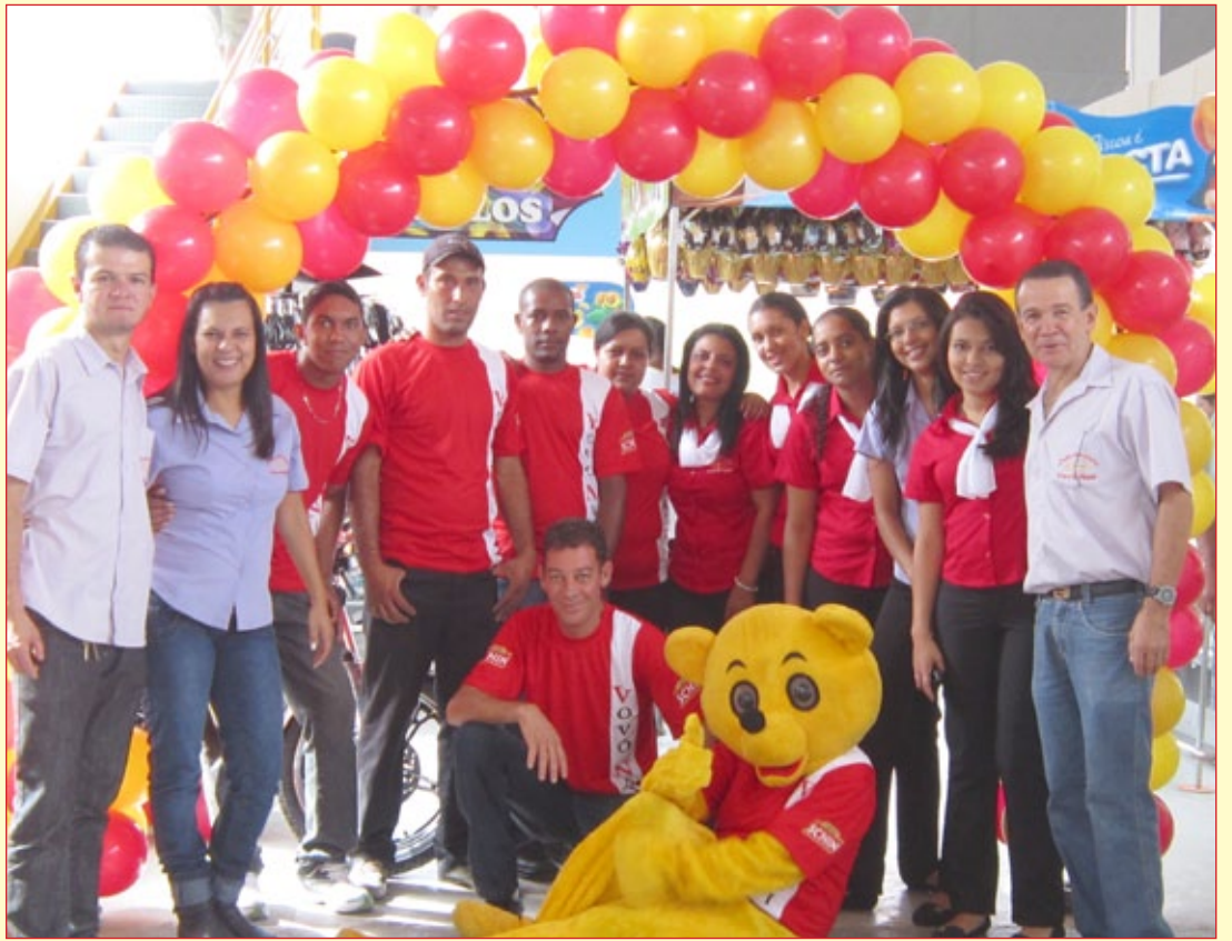
Parte da equipe da Vovó Nair, supermercado segue ampliando também o número de funcionários

E para comemorar a modernização do atendimento ao cliente de Cachoeira do Campo, o supermercado sorteará, em breve, uma moto para quem comprar no local. Logo serão divulgadas as regras do sorteio, como valor de compras para receber o cupom promocional e as datas de prazo da promoção e dia do sorteio.