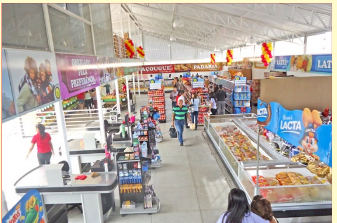
Clientes serão recebidos em instalações mais modernas, já com maior variedade de produtos