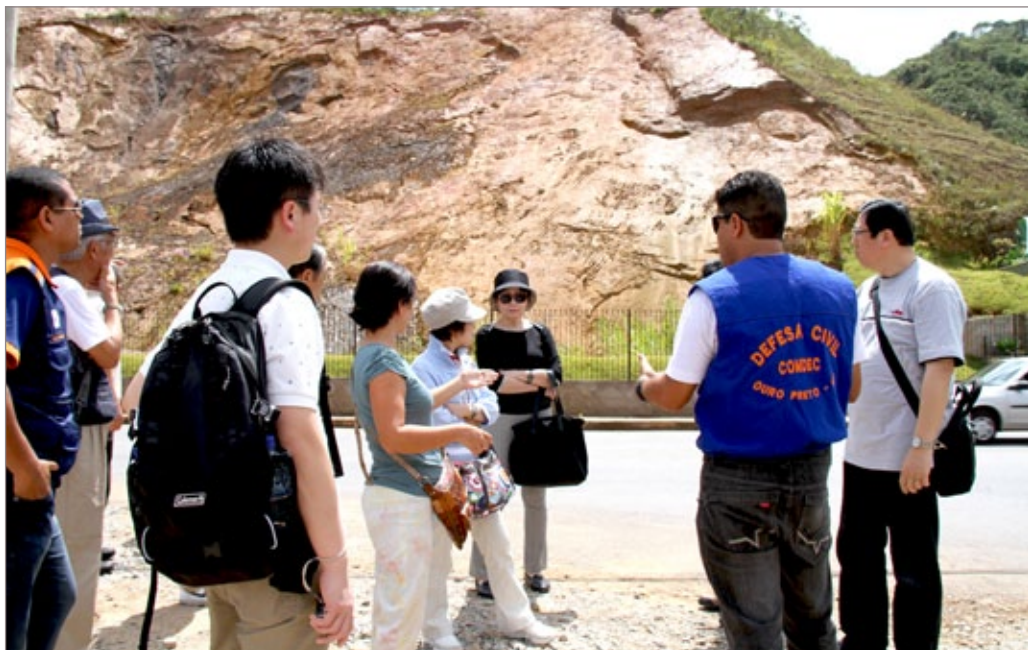
Visita técnica da comitiva ao desmoronamento da rua Padre Rolim

Dossiê de cenário geotécnico da cidade e Simpósio foram os temas abordados