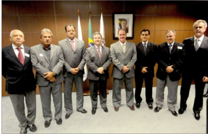
Governador Antônio Anastasia se reúne com representantes da AMIG

As alíquotas aplicadas sobre o faturamento líquido para obtenção do valor da Compensação variam