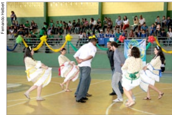
Grupo Dança Rosário faz apresentação de danças folclóricas