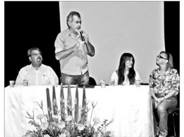
O prefeito Alex Salvador ressaltou a importância dos Conselhos Municipais

Exerce funções deliberativas, normativas, fiscalizadoras e consultivas, tendo como objetivo básico estabelecer, acompanhar e executar a política de habitação no município.