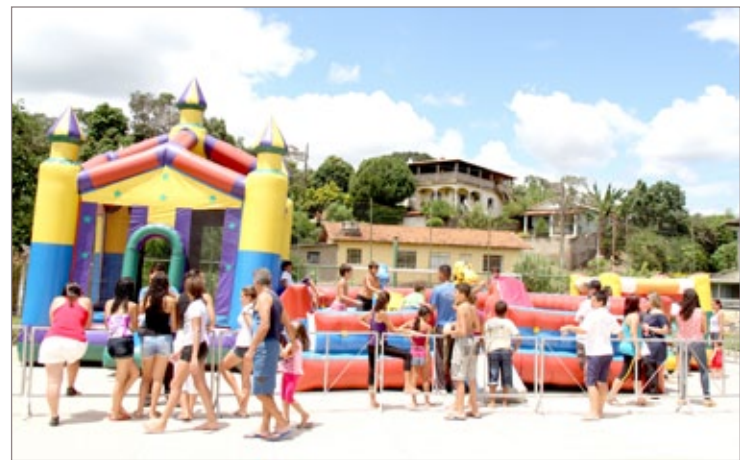
Rua de Lazer realizada no distrito de Amarantina, em março

As atividades acontecem no próximo domingo (14), a partir das 13h, na rua Juca Geraldo, ao lado da igreja Santo Antônio.