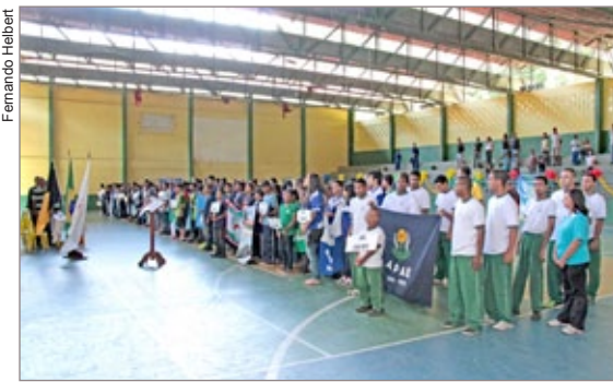
Atletas dos Jogos Escolares de Ouro Preto