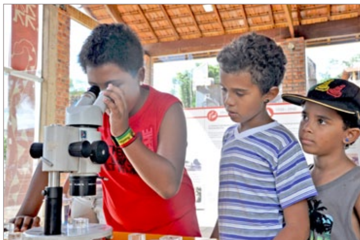
Adolescentes com vontade de aprender a respeito de ciência, durante a exposição

A Feira de Adoção de cães da Sociedade Protetora dos Animais Vidanimal também aconteceu no