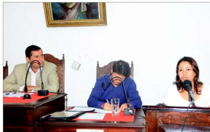
Aluna do CRAS Alto da Cruz pede apoio ao Legislativo para permanência do Professor de Expressão Corporal