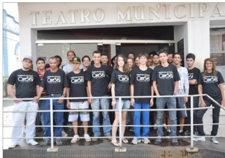
A Oficina ficou lotada e os participantes aprovaram a experiência