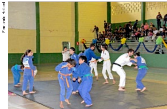
Apresentação de alunos da Academia Judocom