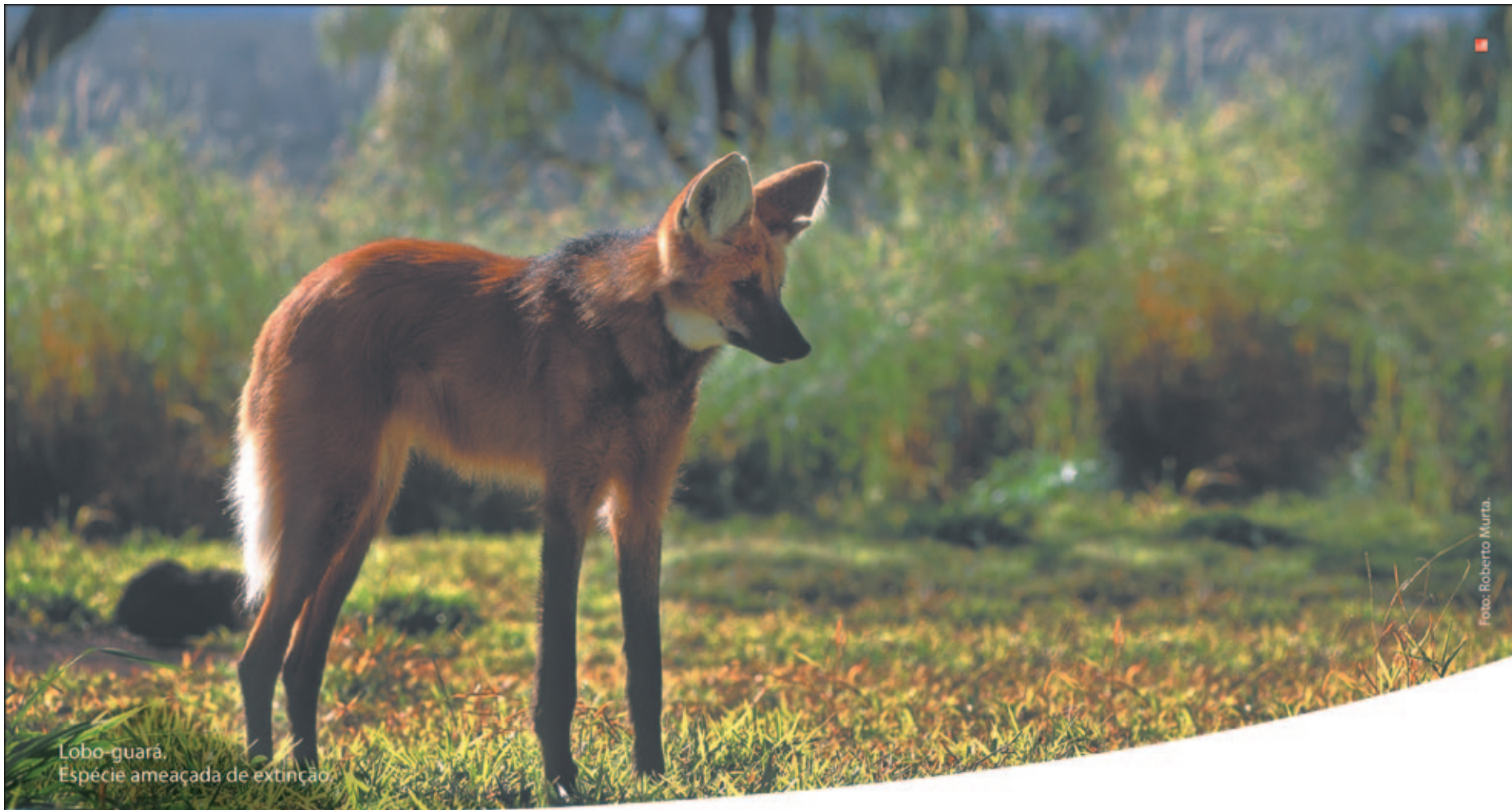
Lobo-guará. Espécie ameaçada de extinção.

A Delegacia de Polícia Civil de Itabirito apela para que as tantas mulheres que já compareceram lá, levem a frente suas denúncias para diminuir este número que vem aumentando a cada ano.