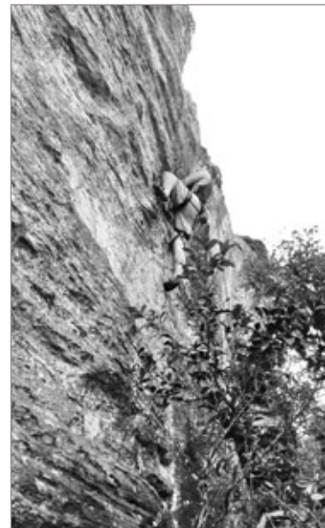
Steffano escalando no Parque das Andorinhas

Os equipamentos essenciais para a prática do montanhismo são: Mochila de Attack - Água e/ou recipientes para água - Clorin (cloro para colocar na água retirada de nascentes duvidosas, mas muitas nascentes não necessitam do cloro) - Comida leve (frutas, sanduíches, chocolate, barras de cereal) - Canivete - Isqueiro - Pequeno estojo de primeiro socorros (esparadrapo, gaze) - Lanterna (de cabeça, se possível) - Protetor Solar - Repelente - Óculos de sol - Roupas leves (dependendo das condições e altitude da montanha) - Calçado resistente - Meias Grossas (evita o aparecimento de bolhas e machucados); - ANORAK (capa de chuva corta vento) - Fleece (blusa de fio leve e sem volume) - Máquina fotográfica.