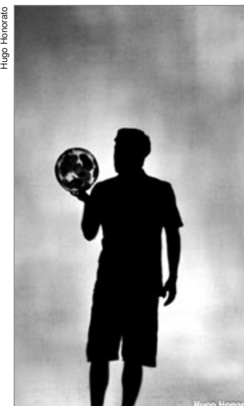
O espetáculo “Piba e o Mundo em Preto e Branco” será apresentado no Sesi-Mariana, no dia 16 de junho, às 16h e às 19h.