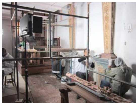
Restauradores trabalham na obra

A igreja Nossa Senhora de Nazaré foi construída na primeira década do século XVIII e ostenta um dos mais imponentes trabalhos de talha dourada da primeira fase do barroco mineiro. As missas estão sendo celebradas na Igreja das Dores durante a reforma.