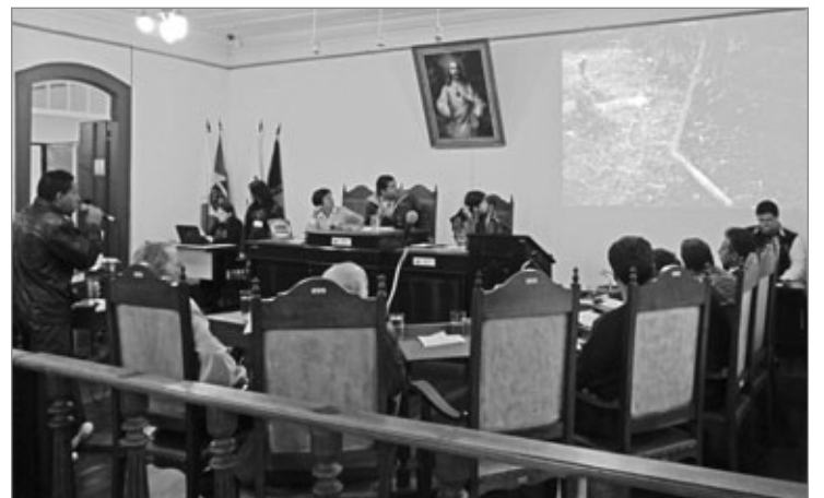
Reunião da semana teve início às 16h56min