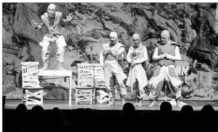
Neste domingo, 9 de junho, às 17h30 e 20h30, o Centro de Cultura SESI-Mariana apresenta o espetáculo “A Família Barata”. O ingresso será um livro a ser doado ao acervo do Ponto Volante de Cultura.

O SESI Mariana lança o 1º Torneio de Truco Mineiro – Jogos SESI. As inscrições terão início nesta segunda-feira, 10 de junho, encerrando-se, dia 24 próximo. Neste torneio não há limites de duplas participantes por indústrias/empresas. Mais informações com: julio.rodrigues@fiemg.com.br