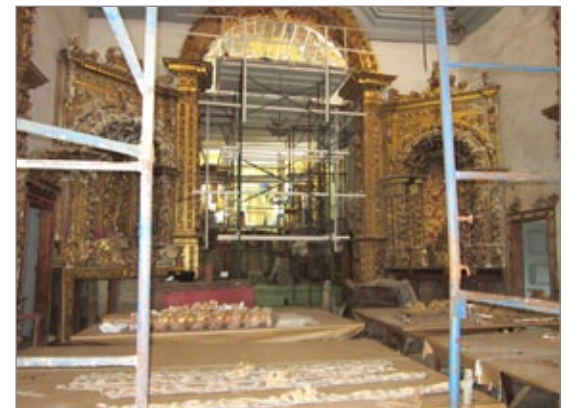
Obras de restauro da Matriz em Cachoeira do Campo