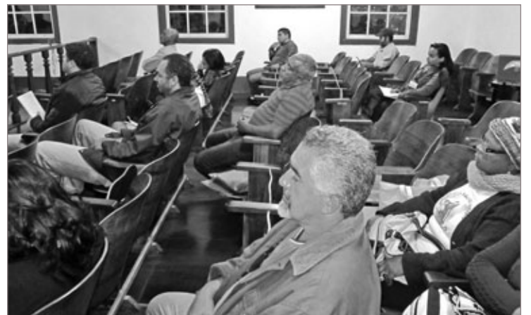
Comunidade aguarda o início da reunião da Câmara

Por enquanto nada tem sido feito para mudar a situação, e os vereadores que ainda comparecem no horário marcado de 16h, argumentam que não podem iniciar a reunião sem quórum, e acabam sendo prejudicados pelos atrasados.