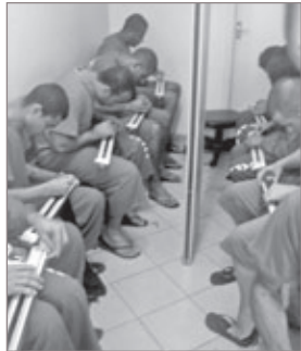
Detentos durante curso de tear

Entre as atividades que os detentos têm acesso no presídio de Ouro Preto estão cursos de artesanato em palito e papel, curso de tear e atividades esportivas. Na última semana de junho, os presos disputaram entre si, ceca contra ceca, um Campeonato de Futebol organizado pela direção da unidade, o time vencedor recebeu medalhas como forma de reconhecimento. Também