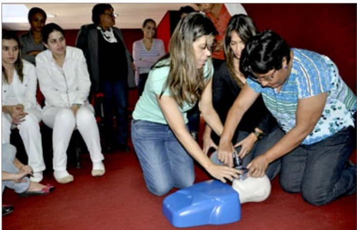
Enfermeiros aperfeiçoam conhecimentos na prática

Outra ação, proposta pelo deputado na área de saúde foi a viabilização de R$ 90 mil para a aquisição de uma Van zero quilômetro, de 16 lugares, destinada ao transporte de pacientes. O recurso foi liberado pelo Governo de Minas através de convênio celebrado com a Secretaria de Estado de Saúde.