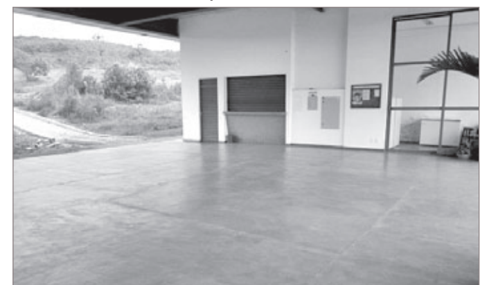
Salão de visitas vazio e lanchonete fechada