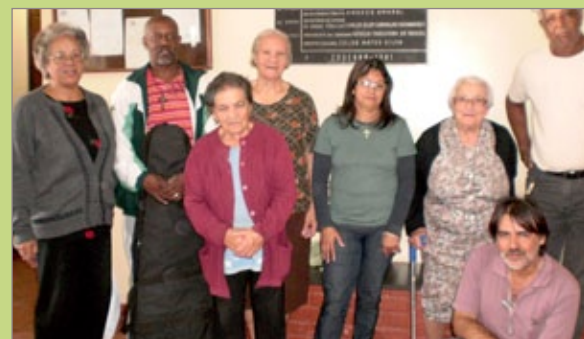
Voluntários da Pastoral Carcerária