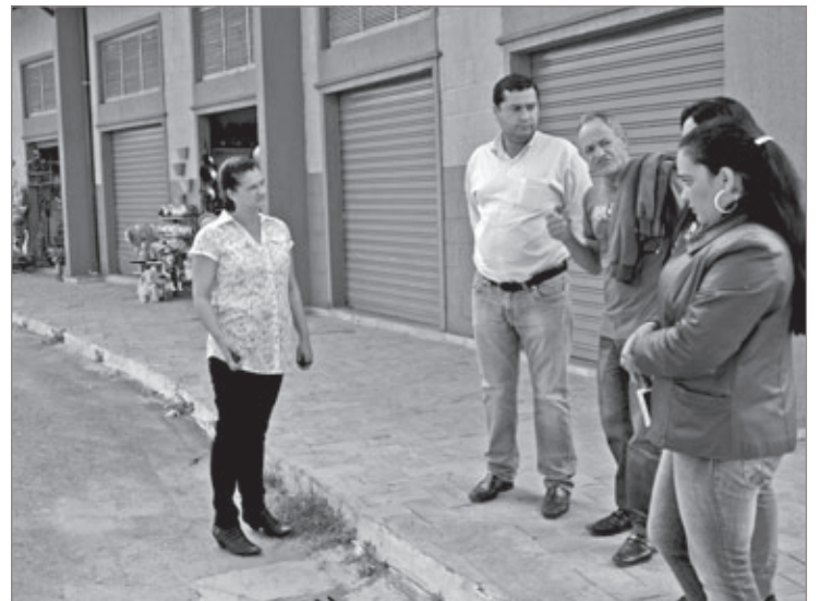
Vários lojistas interromperam as atividades de seus ateliês diante das dificuldades que geraram queda nas vendas