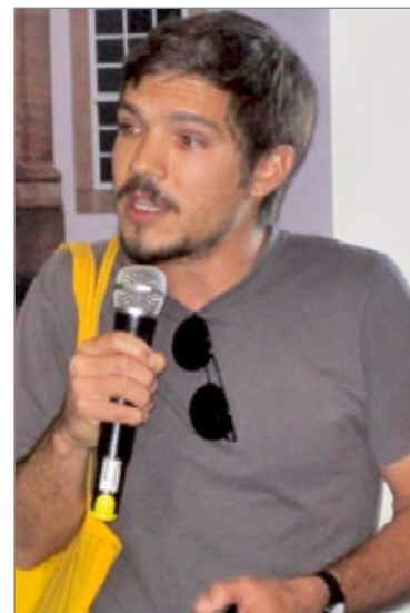
Professor questionou obra do túnel