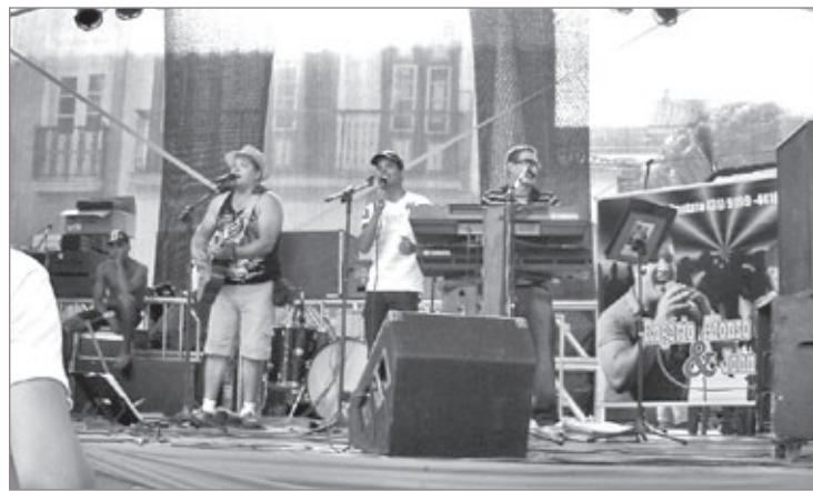
Banda ouro-pretana durante apresentação

Os idealizadores do projeto dizem ter visto a necessidade de união da classe devido à sua desvalorização na região. “Falta de oportunidades e empregos, atrasos de pagamentos, falta de transporte e apoio para as apresentações e uma tabela de cachê. O músico