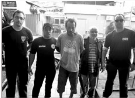
Equipe da Delegacia de Polícia Civil após busca bem sucedida por criminoso

São Gonçalo do Bação livre de homem que aterrorizava comunidade