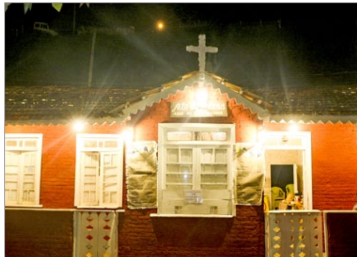
A Associação do Alto da Antena foi a campeã do Julifest 2013