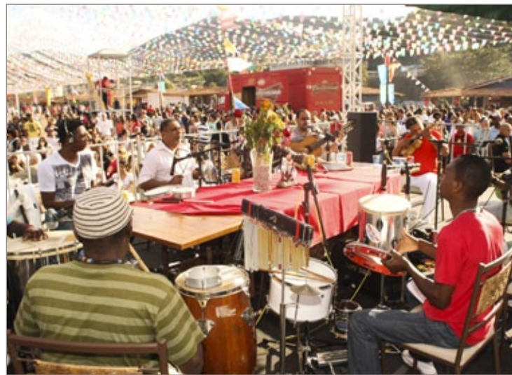
Roda de Samba foi a grande novidade do Julifest

tradicional que pertence ao povo de Itabirito e que é responsável por atrair muitos turistas e movimentar a economia local. Esse sucesso é resultado de diversos fatores como o envolvimento das associações, atrações com estilos variados, iguarias típicas da região muito bem preparadas e uma programação durante o dia e à noite".