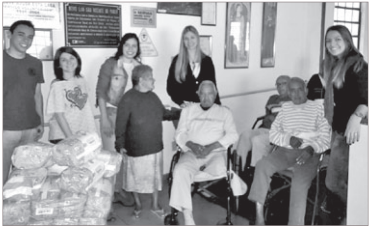
Universitários durante visita ao Lar São Vicente de Paula

Os estudantes arrecadaram as fraldas durante um evento chamado “Rock de Socialização da ARROP” e já no fim de semana se reuniram para levar as doações até o Lar. A ação aconteceu a fim de concretizar um dos objetivos da Associação, que é ajudar a comunidade ouro-pretana da melhor forma possível. Segundo os universitários que visitaram o Lar que abriga mais de 60 idosos atualmente, a casa necessita ainda de todos os tipos de doações, desde fraldas geriátricas até roupas e alimentos. O Lar fica na Rua Dr. Furtado Menezes, 49, bairro Cabeças.