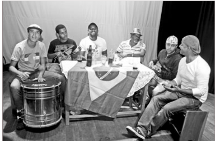
Samba de Boteco