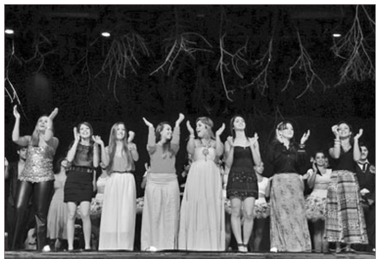
Tributo Elis Regina