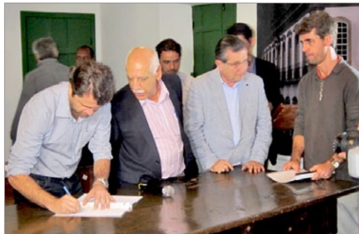
Assinatura de contrato para obra de túnel em Ouro Preto

Ao final da cerimônia, as autoridades foram interrompidas por um morador da cidade e professor de