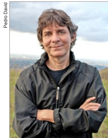
O cantor Lô Borges

Amanhã, sábado, a orquestra se apresenta, às 16h00, na igreja de Nossa Senhora da Conceição, em Engenheiro Corrêa; às 18h00, a apresentação é na igreja do Sagrado Coração de Jesus, em Miguel Burnier; e às 20h30 o circuito de concertos se encerra na igreja de Santa Rita de Cássia, em Santa Rita de Ouro Preto.