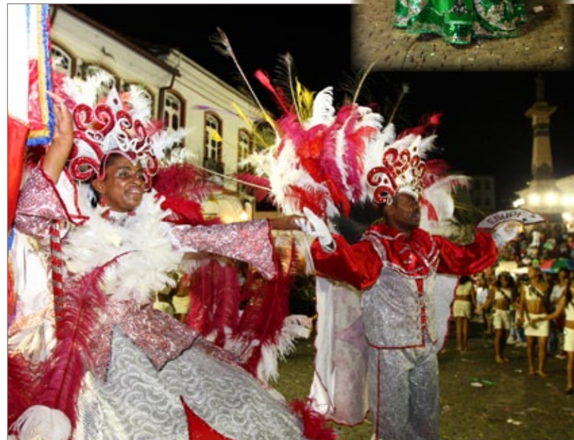
Escolas de Samba de Ouro Preto vão receber R$ 44 mil cada