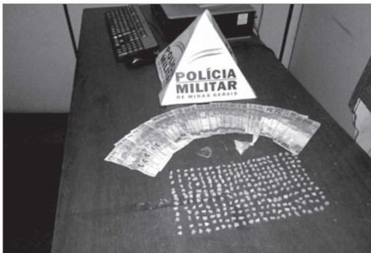
Drogas e dinheiro foram apreendidos na casa do menor

O menor recebeu voz de apreensão de ato infracional e foi levado à delegacia de polícia Civil, juntamente com os materiais para investigação. Está é a segunda vez que o menor é apreendido. A outra ação aconteceu em novembro no mesmo local. Na ocasião foram apreendidas 340 pedras de crack.