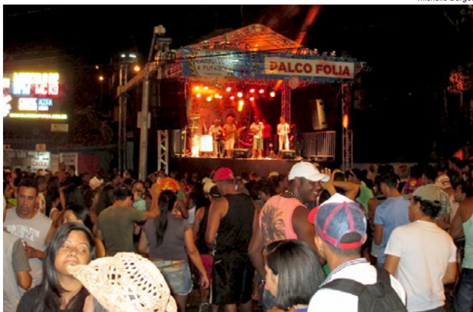
Palcos espalhados pela cidade animaram os foliões