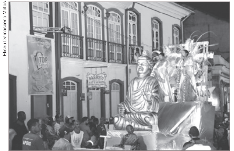
Escola de Samba União do Santa Cruz é a grande campeã

6º lugar – Imperial de Ouro Preto – 150,8 pontos