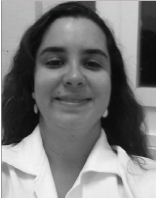
A fonoaudióloga destaca a importância do repouso e da hidratação vocal

Além dessas dicas para reabilitação vocal, é bom evitar o cigarro, que possui substâncias irritativas para a mucosa da prega vocal e tem potencial cancerígeno. É também essencial não forçar a voz principalmente durante períodos pré-menstruais, crises alérgicas, estados gripais e dispensar o consumo de alimentos que causam azia e má-digestão. Assim, é importante se ater aos cuidados com sua voz e audição para continuar festejando e se divertindo com segurança por muitos carnavais.