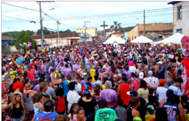
A Praça da Matriz lotou em Cachoeira do Campo