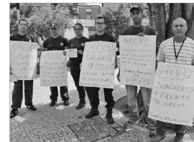
GCM está em greve desde o dia 28 de fevereiro