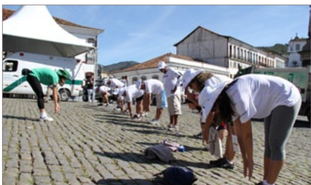
Participantes fazem alongamento antes da caminhada