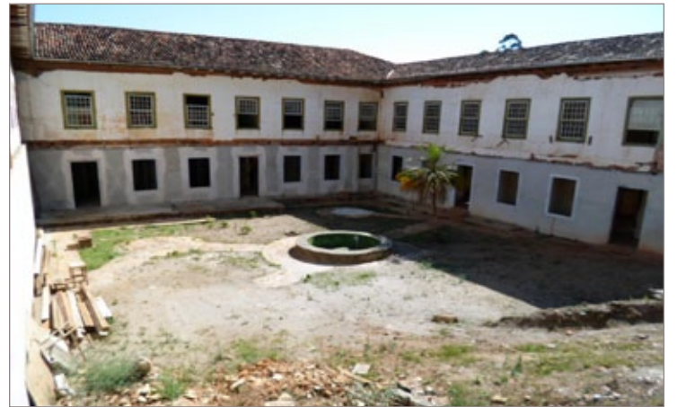
Finalização da obra depende da contrapartida da prefeitura

De 2009 a 2012, houve uma interrupção das obras em função da readequação do espaço, por ser uma obra de grande estrutura e complexidade e que demandou várias alterações no projeto. Em março de 2012, a ADOP conseguiu a celebração de um contrato com o BNDES para dar sequência aos trabalhos, e a empresa ouro-pretana Hexágono Engenharia, ficou a cargo de executar o projeto.