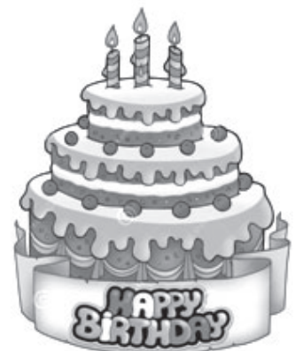
A Escola Municipal “Bonequinha Preta” está em festa, pois no dia 19 de março estará completando 42 anos de existência, educando com amor e qualidade!