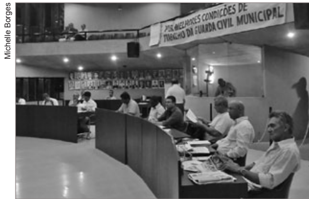
Durante reunião da câmara, Guarda Municipal faz manifestações

Na manhã do dia seguinte, a vítima foi encaminhada para um hospital de Belo Horizonte pelo helicóptero do Corpo de Bombeiros Militar de BH.