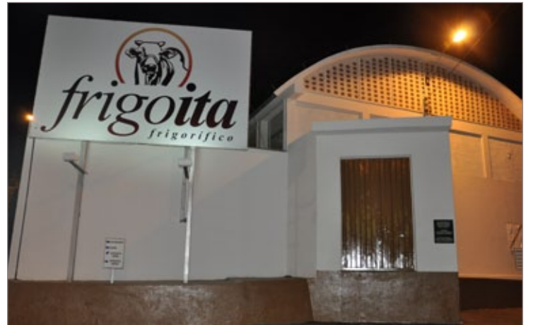
Frigoita é inaugurado e já está funcionando. As carnes já saem do frigorífico certificadas