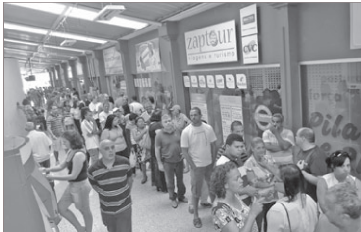
Grande número de cooperados compareceu na eleição, e não desanimaram mesmo com as grandes filas