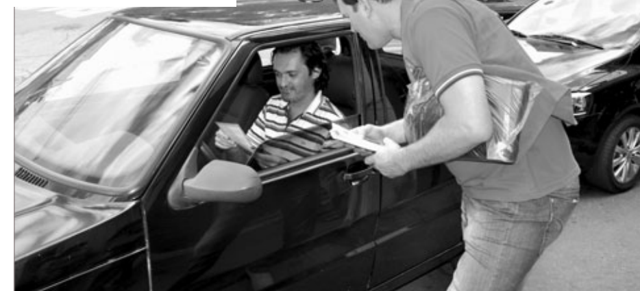
Bliz teve o objetivo de conscientizar motoristas sobre a importância do IPVA

Aditivo 010/2014 – 1º Termo Aditivo ao Contrato Nº 049/2013 – Credenciamento Nº 001/2013 – Credenciamento de instituições bancárias e não bancárias. Credenciada: CÂMARA DE DIRIGENTES LOJISTAS DE ITABIRITO. CNPJ: 19.150.697/0001-05. VALOR: 12.328,17. Vigência: 01/03/2014 a 01/03/2015. Dotação: 02.005.002 – 040.2.350-3390390000- 124