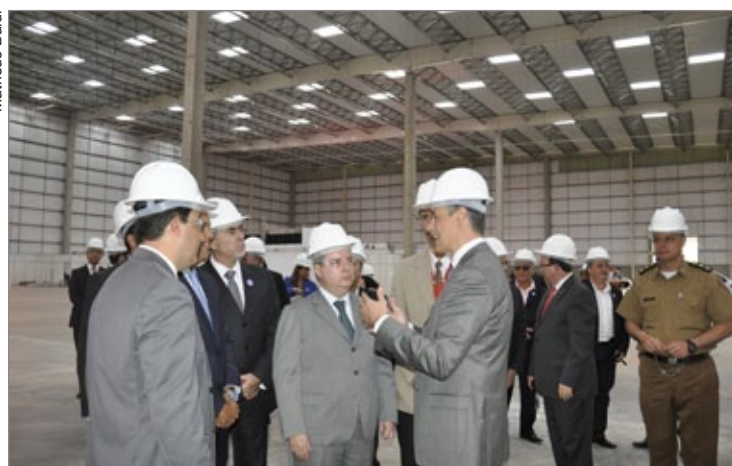
Autoridades conheceram as futuras instalações da fábrica, que será a maior da Coca-Cola no Brasil

ck, o local virou ponto de atração e outras oito companhias já manifestaram o interesse de instalar ali suas atividades.