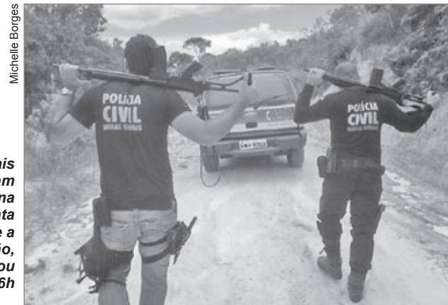
Policiais montaram campana na mata durante a operação, que durou 36h

A ação contou com a ajuda do Canil Central da Polícia Civil de Belo Horizonte, que contribuiu nas buscas com cães farejadores. A droga apreendida está avaliada em cerca de R$ 55 mil, e está sob perícia da Polícia Civil. O contrabando de tal volume pode resultar em pena de cinco a 15 anos de prisão.