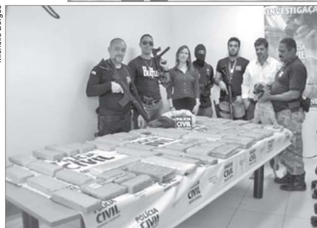
Polícia Civil de Ouro Preto apreende 55 kg de maconha em Ouro Preto