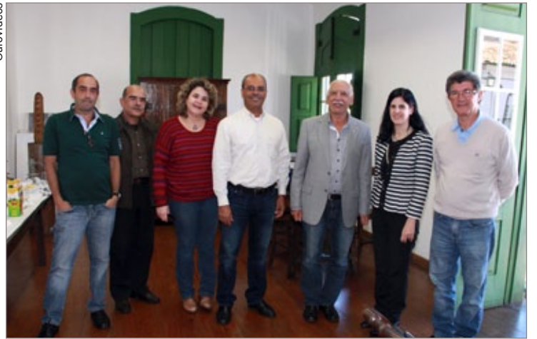
Prefeitura de Ouro Preto e Novelis firmam contrato para duas novas obras

O outro terreno de 10 mil m 2 , próximo à Vila Operária, na região conhecida como Curtume (antigo Barracão de Solteiros) será destinado à construção de uma alça viária ligando a avenida Lima Júnior, conhecida como Curva do Vento, ao Campus da UFOP.