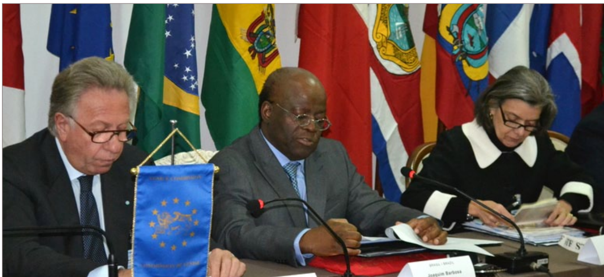
Durante encontro Joaquim Barbosa propôs a criação de uma comissão na América Latina

De acordo com Chiquinho Xavier, já está programada uma visita a campo no dia 19 de maio, para avaliar o terreno onde será construído o aeroporto. Durante a reunião foi confirmado que o distrito de Glaura irá receber a implantação do campo de aviação. Ainda conforme o vice-prefeito, se o espaço estudado comportar uma estrutura maior, o aeroporto poderá ser classificado como categoria C4, sendo possível o tráfego de aviões com maior capacidade de transportar passageiros, como os Boeings.