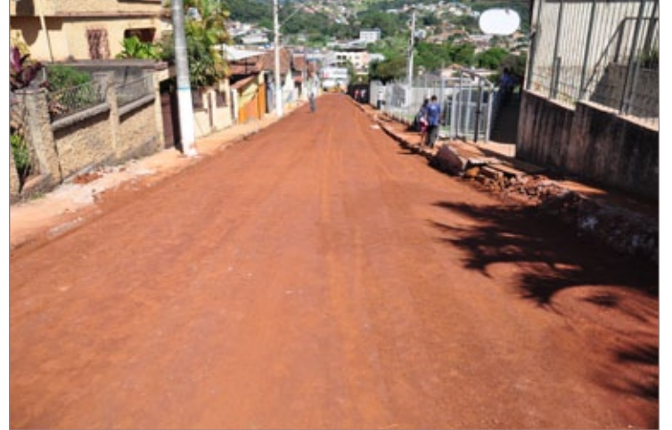
Fase final das obras na Rua José Benedito

A obra teve início no começo do mês de abril e está prevista para ser finalizada na próxima semana.