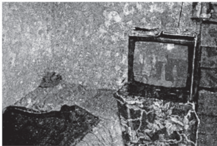
Quarto, cama e televisão no Aglomerado da Serra, Belo Horizonte.

Já me disseram que se eu não acompanhar vou ficar desatualizada. Faz sentido, mas depende de onde e do que eu queira atualizar-me. A hora que me fizer falta, faço um curso ou aprendo "futucando" o computador, como muita gente faz. Esta hora ainda não chegou. Ainda fico com meus emails e digitação em teclado. Enquanto isso, prefiro continuar sem entender uma simples novela. Quando ela chegar mais para o meio da história, com cenário definido e a trama se tornar o casal apaixonado enfrentando dificuldades para viver o seu amor, eu passo a entender.