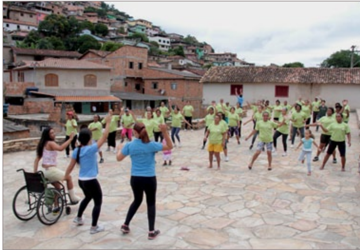
Projeto Comunidade em Movimento já acontece nos bairros Água Limpa e Padre Faria

Para participar das atividades basta comparecer no adro da Capela Nossa Senhora das Dores, de 12 a 23 de maio, das 7h30 às 10h30. Há um questionário sobre a saúde do corpo que deve ser preenchido, de forma que os profissionais saibam a melhor maneira de trabalhar os exercícios com cada pessoa.