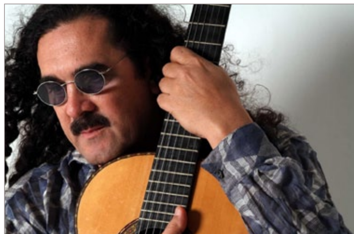
Moraes Moreira, um dos pilares dos Novos Baianos, está no Festival da Vida

Grandes Shows – Na abertura (hoje, 09 de maio) na Praça Minas Gerais, subirão ao palco o Grupo Cobra Coral, às 21h30 e o músico Toquinho, às 23h, que prestará uma homenagem ao centenário de Vinícius de Moraes. Durante os próximos dias de festival,