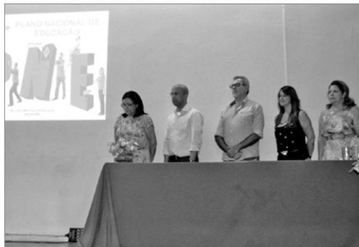
Autoridades compuseram a mesa para discutir o Plano Municipal de Educação para os próximos 10 anos

Esteve presente, também, no evento a secretária de educação da Prefeitura de Mariana, que, na oportunidade, parabenizou o trabalho realizado pela Administração e o qualificou como “excelente”. Completou dizendo, ainda, que “dar ini-