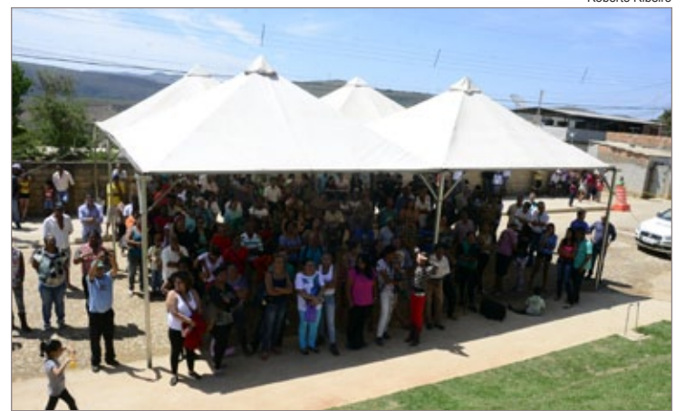
103 famílias tomaram posse de suas casas