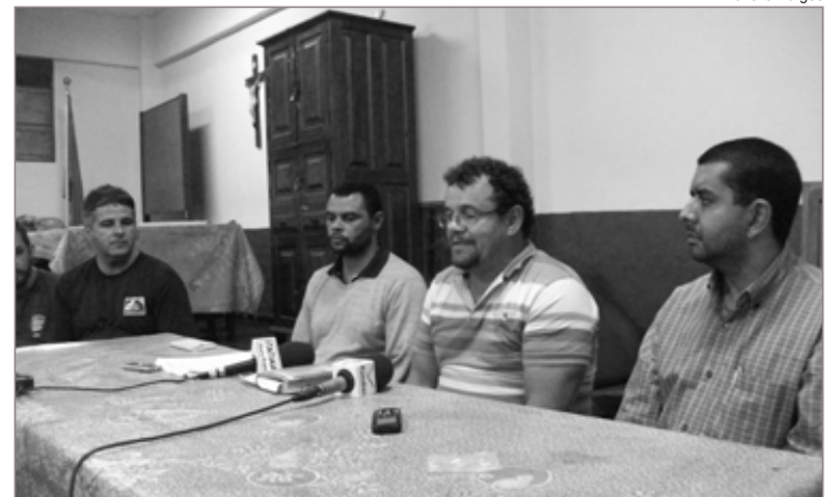
Em coletiva de imprensa, representantes do sindicato destacaram ações para manutenção dos postos de trabalho