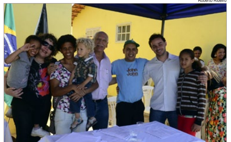
Prefeito, vice e secretária ao lado de uma das famílias beneficiadas pelo programa