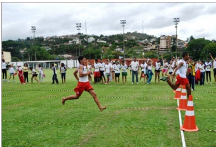
Durante dois dias de evento, 524 alunos participaram das atividades esportivas