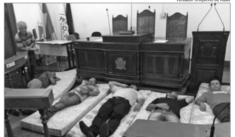
Em protesto, sindicato acampa na Câmara