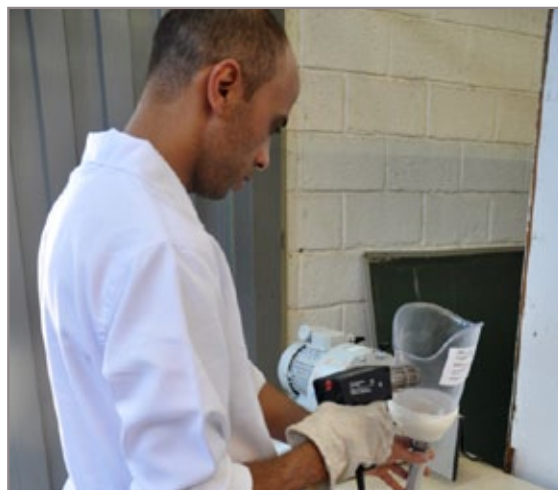
CER IV Diamantina e Ottobock fornecem as próteses e treinam os fisioterapeutas da região

“Com esta primeira prova, iremos fazer os ajustes necessários. As próteses ficarão aqui no