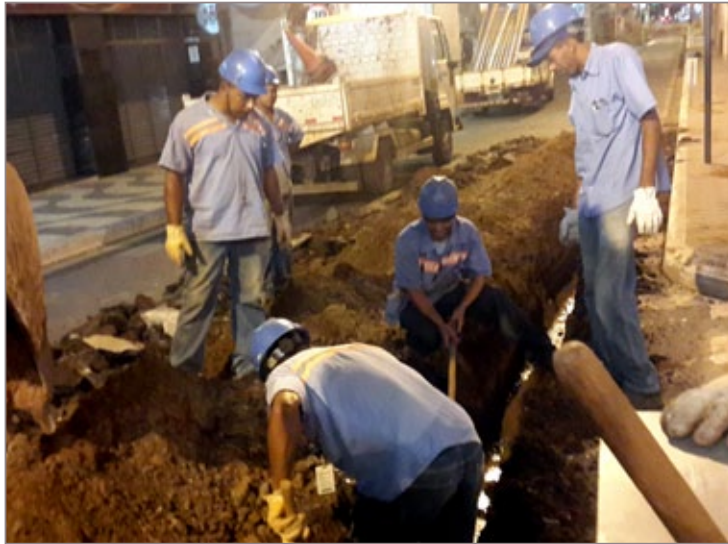
Obras na Rua Dr. Guilherme irão evitar alagamentos na região central da cidade

O objetivo da intervenção é evitar alagamentos na região central da cidade durante períodos chuvosos. Para tanto, duas manilhas de 600 milímetros irão substituir apenas uma de 300 que havia no local, aumentando assim a capacidade de escoamento das águas de chuva em oito vezes. As obras acontecem durante o período da noite, quando o movimento