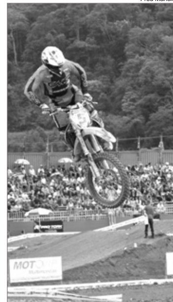
Durante o sábado e a manhã do domingo, foram realizados somente treinos classificatórios. A cerimônia de abertura, celebrada na pista, deu início às competições na tarde de domingo