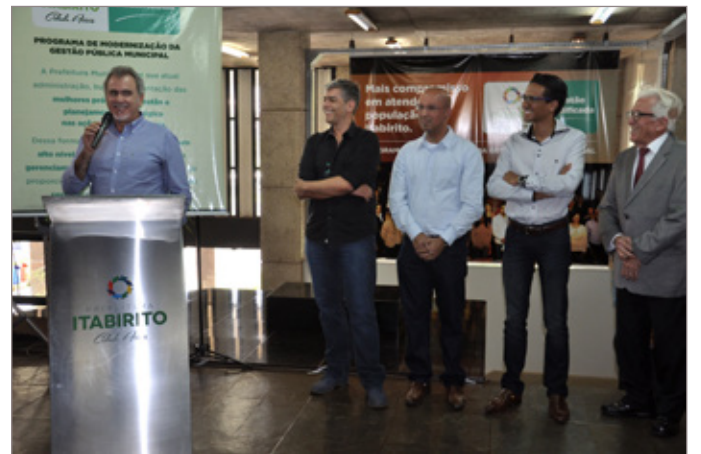
Um dos grupos de gestores que fizeram parte dos trabalhos de excelência em gestão pública

Desde abril de 2013, a Prefeitura investe na excelência dos serviços oferecidos à comunidade, aprimorando cada vez mais o trabalho graças ao entusiasmo da equipe, envolvimento dos gestores e a parceria com uma consultoria especializada neste tipo de treinamento, o Instituto Áquila. Não é à toa que a Prefeitura de Itabirito foi reconhecida em 2014 pela implantação de boas práticas de gestão,