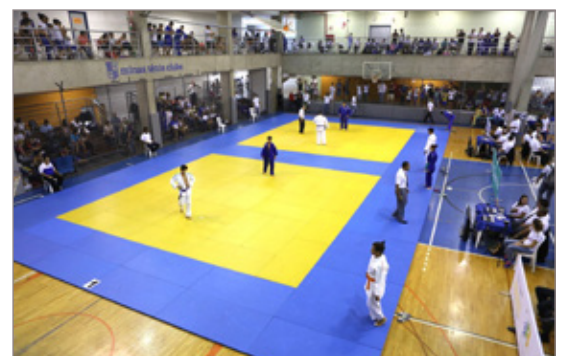
A equipe conta com o apoio do IFMG/Ouro Preto

Composta por 14 atletas masculinos e femininos, a equipe de Judô de Ouro Preto disputou no Minas Tênis Clube em Belo Horizonte, o Torneio Início da Federação Mineira de Judô. A