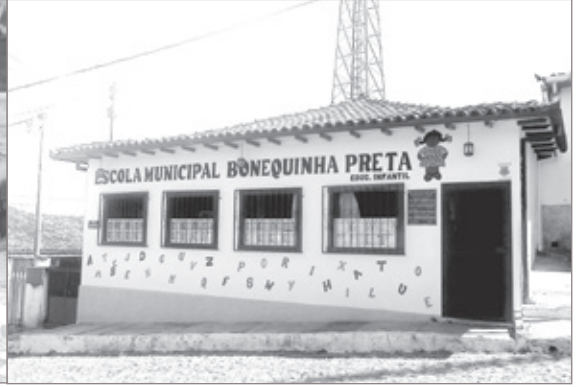
A Escola Municipal Bonequinha Preta, de Educação Infantil, comemorou seu aniversário no dia 19/03, juntamente com seus alunos e sua equipe. Parabéns pelos seus 43 anos de educação para a vida!