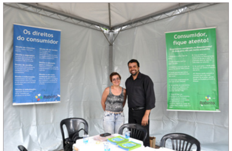
Um estande na Praça da Estação foi montado para atender os cidadãos durante a Semana do Consumidor