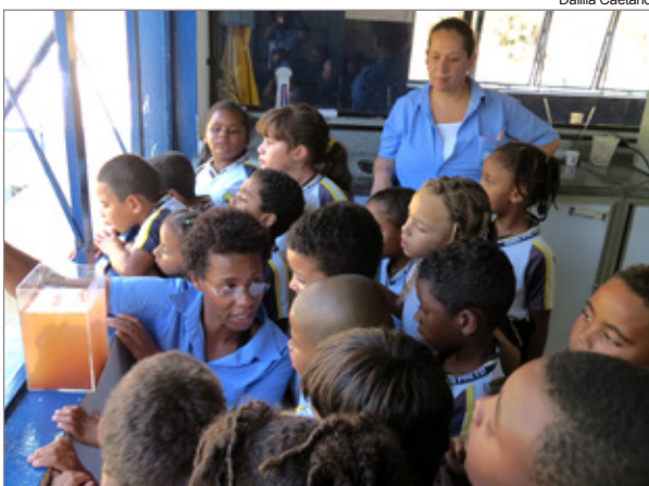
Visita à ETA Itacolomy

25/03 - quarta-feira Horário: 8h30min; Palestra: Importância da água; Local: CAIC.