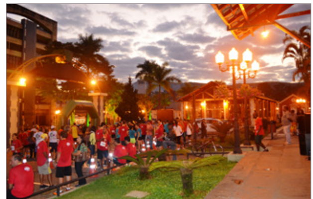
Corrida noturna atraiu competidores da cidade e região

O esporte não para em Itabirito! Neste final de semana, a Secretaria de Esportes e Lazer realiza o Uaironman. No sábado, dia 20, os atletas disputarão a prova de natação, no União Sport Club, às 14h. Já no domingo (21) é a vez dos competidores testarem seus próprios limites nas modalidades de Mountain Bike e Corrida, a partir das 8h, com saída do Poliesportivo da Carioca. Venha participar deste evento e traga a sua família!