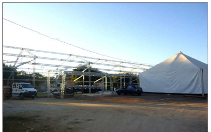
Estrutura do local do evento sendo desmontada após polêmico baile de formatura dos alunos da Ufop

Em contato com a Ufop, a assessoria de comunicação informou que a universidade é apenas responsável por organizar e realizar a Colação de Grau Unificada. "As atividades festivas, por sua vez, são de responsabilidade daqueles alunos que se organizam voluntariamente em grupos financiados por eles próprios, com CNPJ específico, ficando a seus cargos as contratações de locais para os bailes, assim