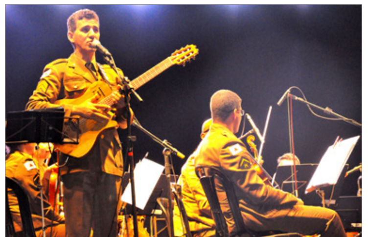
Orquestra Sinfônica da Polícia Militar se apresentou durante as comemorações