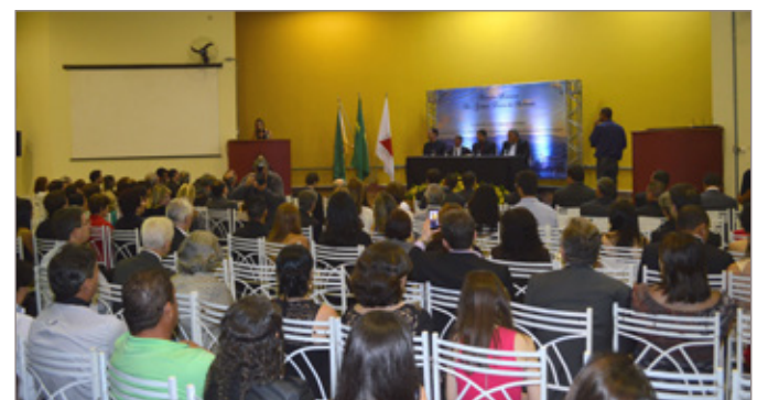
Câmara homenageia marianenses que elevam o nome de Mariana em outras cidades