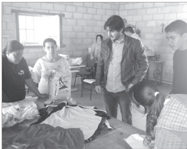
Maciel pode ser mais um dos distritos de Ouro Preto com viabilidade de entrar na era digital.

E as boas perspectivas para Maciel não param por aí: Thiago Mapa reforçou ainda o propósito de através da Câmara Municipal, levar a Internet Popular à localidade, permitindo à comunidade se sentir ainda mais socialmente inserida.