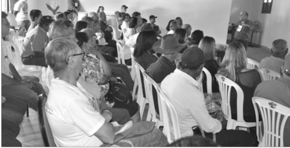
No ano passado, o evento foi prestigiado por um grande número de pessoas. A sala de palestra ficou lotada

No próximo domingo, dia 13 de setembro, a Prefeitura, por meio da Secretaria de Agricultura, Pecuária e Abastecimento realizará a 24ª edição do Dia de Campo. O evento acontecerá no Campo de Futebol de São Gonçalo do Baço. As atividades terão início às 8 horas da manhã. Confira a programação que faz parte das comemorações de aniversário da cidade.