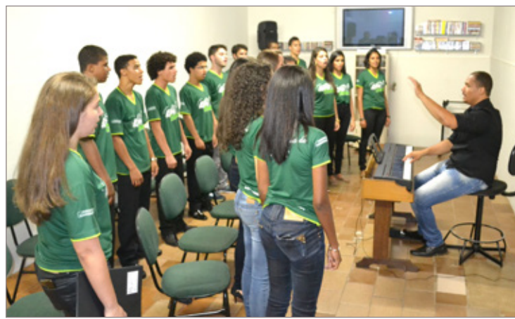
Atualmente, 250 alunos participam das atividades ofertadas pelo Coral