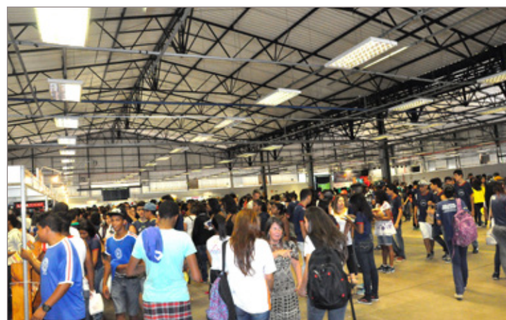
Grande público marcou presença na 11ª edição da Feira do Livro de Itabirito