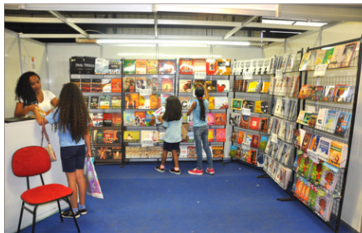
Livros foram vendidos a preços populares