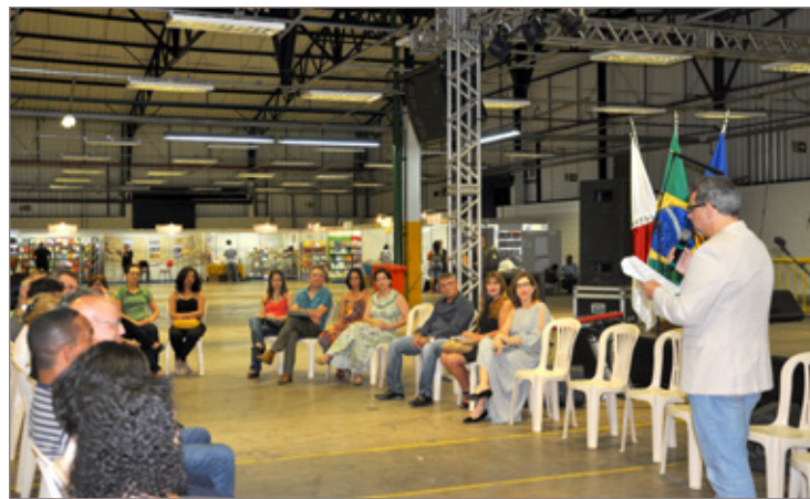
A abertura do evento ocorreu no dia 4 de novembro