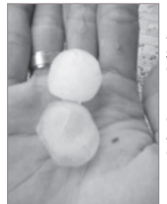
Pedras gigantes destruíram telhados e janelas das casas