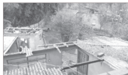
Moradores relatam que nunca viram uma tempestade tão devastadora como a do sábado