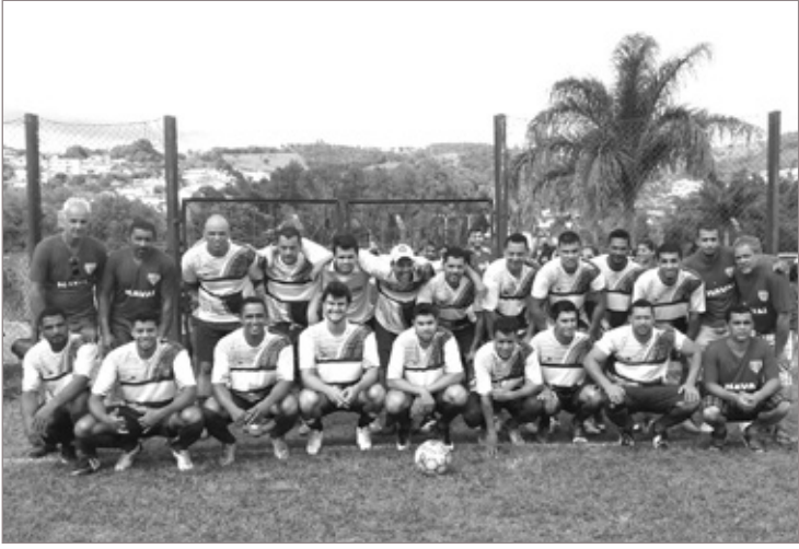
O Time Havai FC, campeão no Campeonato Cachoeirão, realizado em maio deste ano com vitória sobre o Santa Luzia FC, conquistou mais uma taça no domingo (22) dessa vez no Campeonato de Bairros contra o Independente FC. Toda a equipe parabeniza seus jogadores e agradece a todos os patrocinadores.