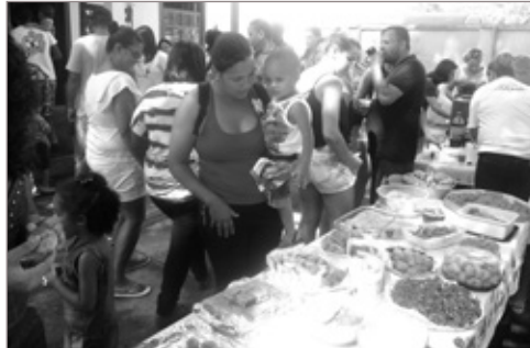
A Creche Criança Feliz promoveu no dia 14 de novembro a “2ª Mostra Cultural: Ser diferente é normal” com o objetivo de apresentar às crianças as diversidades, para que possam conhecê-las, respeitá-las, e sobretudo perceber que ser diferente é normal. Durante o evento, realizado na própria instituição, foram expostos e apresentados os trabalhos das crianças. Os pais ajudaram com o lanche compartilhado.