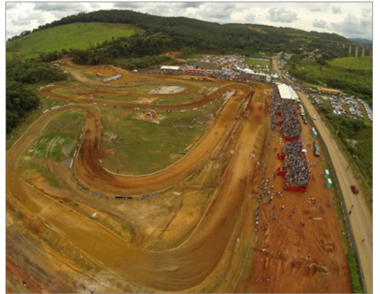
Pista de Itabirito, onde será disputada a Copa Pro Tork MG de Motocross