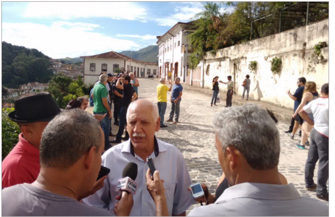
Rua Getúlio Vargas reaberta

Essa é apenas uma das etapas das obras que a Prefeitura irá concluir em Ouro Preto. Atualmente, encontra-se também em recuperação a Rua Prefeito Washington Dias. Assim que for finalizada, em março, terá início a obra na Rua Rua Tomé Afonso – duas importantes vias de ligação na cidade. “Nós temos trabalhado com organização e planejamento para que possamos atender aos anseios de melhoria da população”, resalta o secretário de Obras.