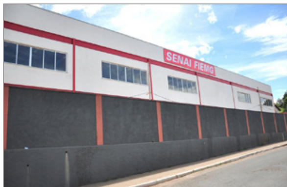
A unidade do Senai foi inaugurada em Itabirito e está em pleno funcionamento

O transporte dos alunos também está sendo prioridade para a administração municipal, dois ônibus escolares foram adquiridos para atender os estudantes da zona rural. Os alunos que cursam graduação em outras cidades como Belo Horizonte, Mariana, Ouro Preto, Congonhas, Conselheiro Lafaiete e Ouro Branco são beneficiados com transporte gratuito.