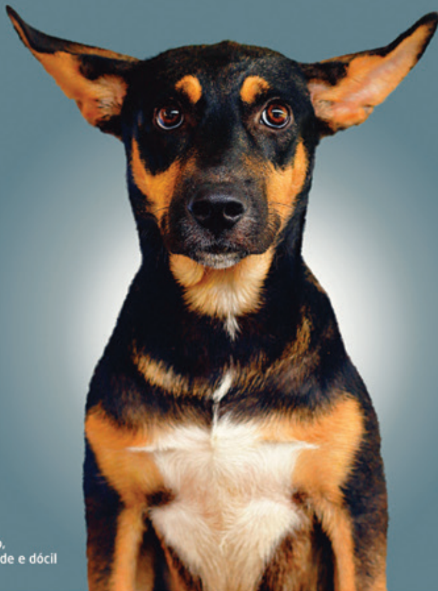
Macho, adulto, de porte grande e dócil

Sua amizade pode mudar a minha vida. Minha gratidão vai mudar a sua.