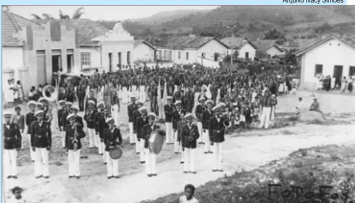
Banda Santa Cecília ao lado da sede do União