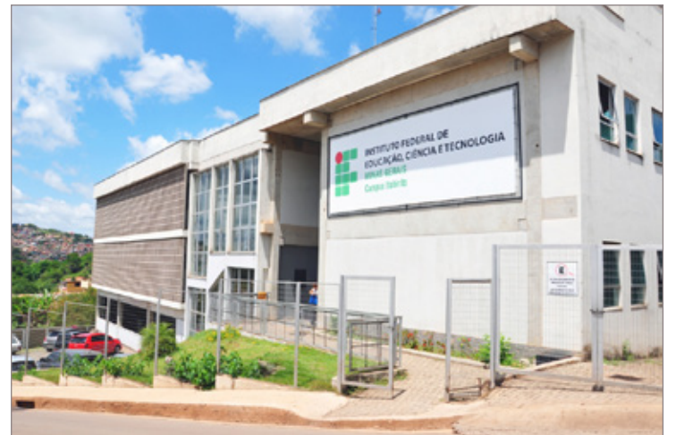
Início das atividades acadêmicas do IFMG em Itabirito, em março de 2015

Uma educação de qualidade se constrói com profissionais preparados, valorizados e reconhecidos. Pensando nisso, a Prefeitura concedeu um reajuste de 40% para todos os profissionais da educação, no período de 2013 a 2014, entre eles diretores, vices, supervisores, administradores e monitores de creches. Além disso, houve a readequação da carga horária dos professores de acordo com 1/3 para