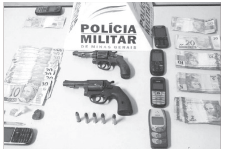
Material apreendido pela Polícia Militar no dia 03 de abril, em Mariana

Após rastreamentos, policiais localizaram os dois autores. O autor de 23 anos foi preso e na sua residência foram apreendidos ainda nove pássaros da fauna silvestre, um cigarro e duas buchas de substância semelhante à maconha, três aparelhos celulares e R$ 620,00 em dinheiro. Já o autor de 22 anos foi localizado em outra residência com um terceiro suspeito, onde foi apreendido um revólver calibre 38, com cinco munições intactas, R$450,00, um celular e um revólver calibre 32 com numeração raspada. Os três autores foram encaminhados para a Delegacia de Polícia Civil de plantão para demais providências, junto a todo material apreendido pela Polícia Militar.