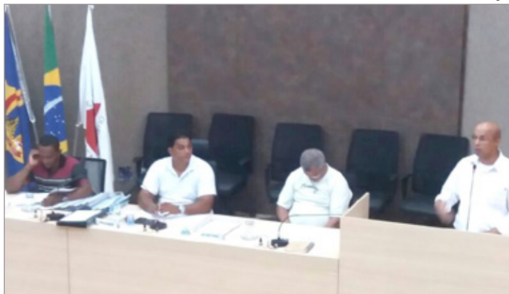
Vereadores discutem possíveis consequências do parquímetro para o comércio da cidade