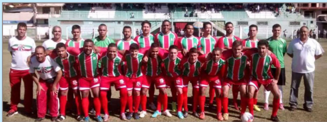
Por falar em esperança: a equipe de futebol do Usina Esperança sagrou-se campeã da Taça cidade de Itabirito no último domingo, motivo de muita festa por parte dos borrachudos e dos atletas do técnico Gil do Lalado

Para Refletir: Todo ser humano é culpado do bem que não fez. (Voltaire).