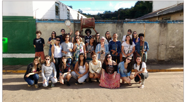
Grupo do Cortejo Minhas Terras ensaia aos fins de semana