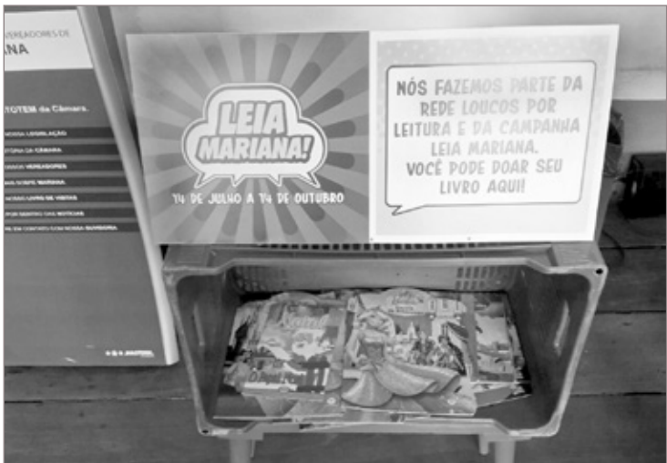
Câmara de Mariana é Ponto de Coleta de livros do Projeto Leia Mariana

Professores - Na mesma reunião, os vereadores tornaram público o abaixo assinado dos professores efetivos não optantes pelo Plano de Cargos e Salários da rede municipal de ensino de Mariana. Os educadores solicitam esclarecimentos por parte da Secretaria Municipal de Educação sobre o motivo que levou a não receberem o prêmio de produtividade pago a todos os professores, inclusive para aqueles que não atuam diretamente na sala de aula.