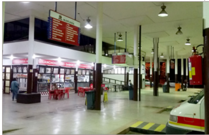
Apenas embarque e desembarque são realizados no local

Viação exigia lanches para motoristas e auxiliares nas paradas das linhas intermunicipais