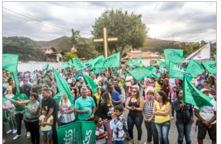
O evento contou com grande adesão popular