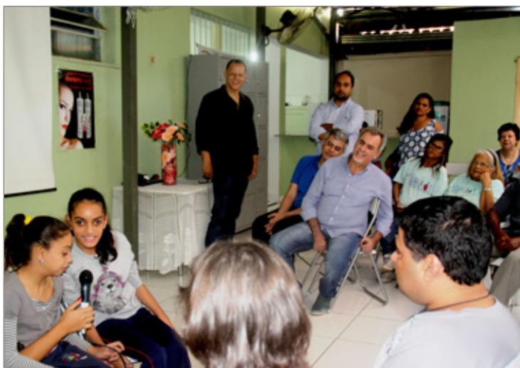
Usuárias fizeram uma apresentação emocionante durante a visita