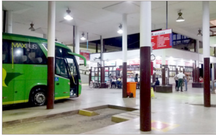
Pássaro verde suspendeu paradas por comerciantes não oferecem lanches a motoristas e auxiliares da empresa