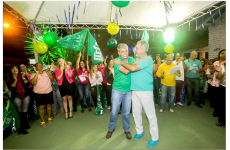
Espírito de paz e alegria deram o tom do lançamento da campanha