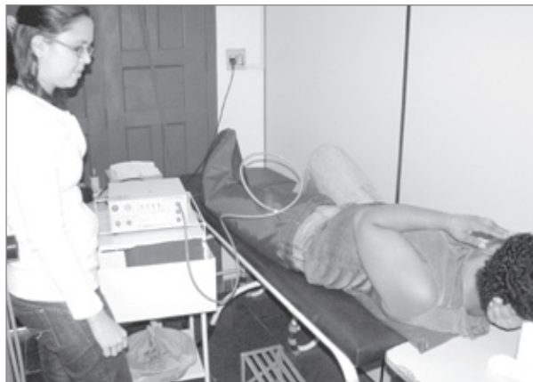
Por falta de contrato, pacientes podem ficar sem atendimento domiciliar