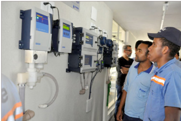
Funcionários do Saae conhecem o sistema de automação