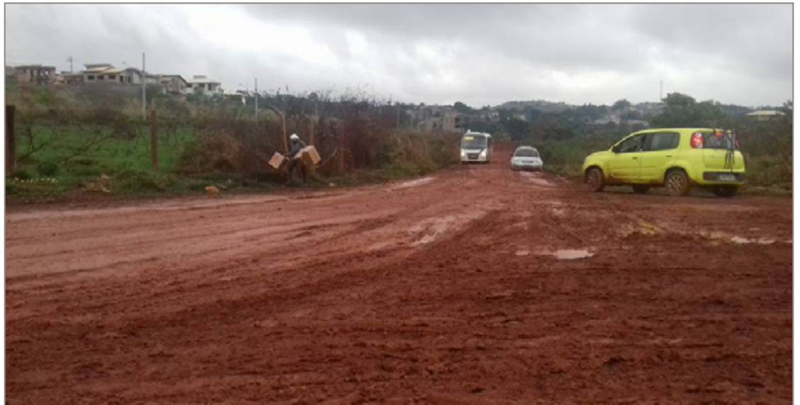
Acesso ao bairro está difícil devido a lama nas estradas

Moradores do bairro Metalúrgico, de Cachoeira do Campo, estão indignados com a falta de atenção do executivo às obras de infraestrutura do local. Com promessas de intervenções há mais de três anos, o bairro hoje até conta com rede de esgoto e pluvial, mas devido à falta de fiscalização na execução dos serviços, o saneamento tem dado muitos problemas. A principal dificuldade atual dos moradores é com relação ao acesso. A pavimentação foi iniciada, mas anda a passos lentos.