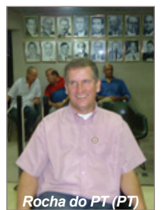
Rocha do PT (PT)