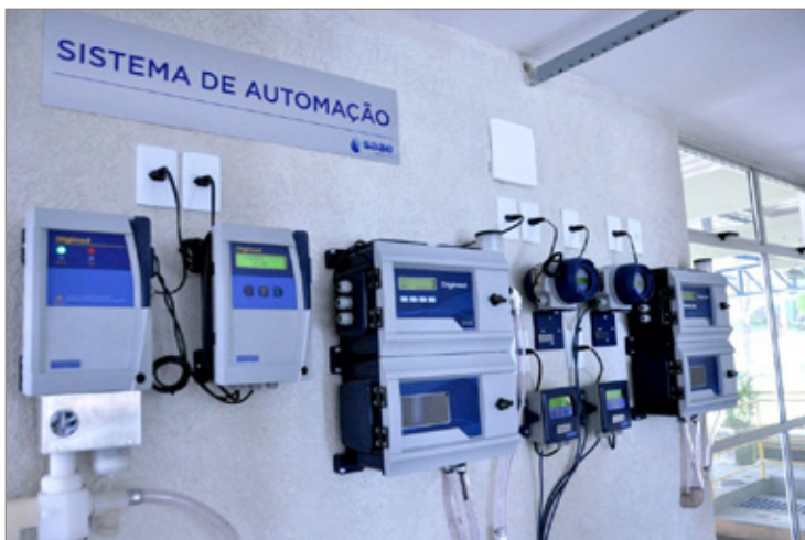
Novo sistema de automação garantirá diminuição das perdas durante o processo

sistema representa um sonho de anos. "A automatização é um sonho nosso que já dura 15 anos e agora podemos comemorar a finalização do projeto. Esta inovação vai trazer um ganho enorme para a população e também para nós, que trabalhamos aqui", explicou.