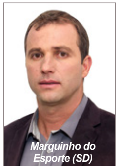
Marquinhos do Esporte (SD)