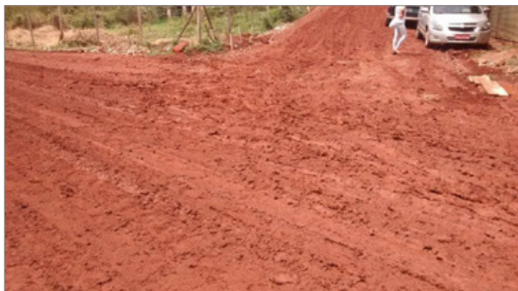
Obras de pavimentação andam a passos lentos

Em janeiro deste ano o Banco BDMG liberou R$1,5 milhões para obras no bairro. Moradores afirmam que a obra segue lentamente e até hoje as principais vias não foram asfaltadas como prometido.