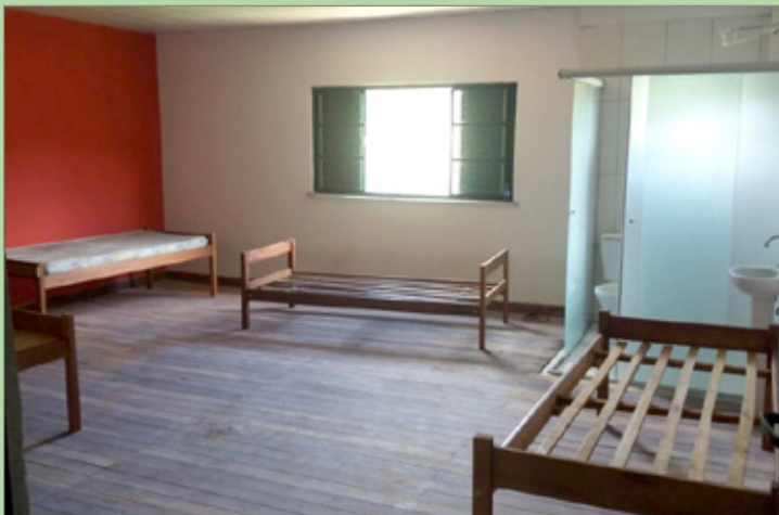
Dormitórios já estão funcionando e o Centro já abriga dois pacientes