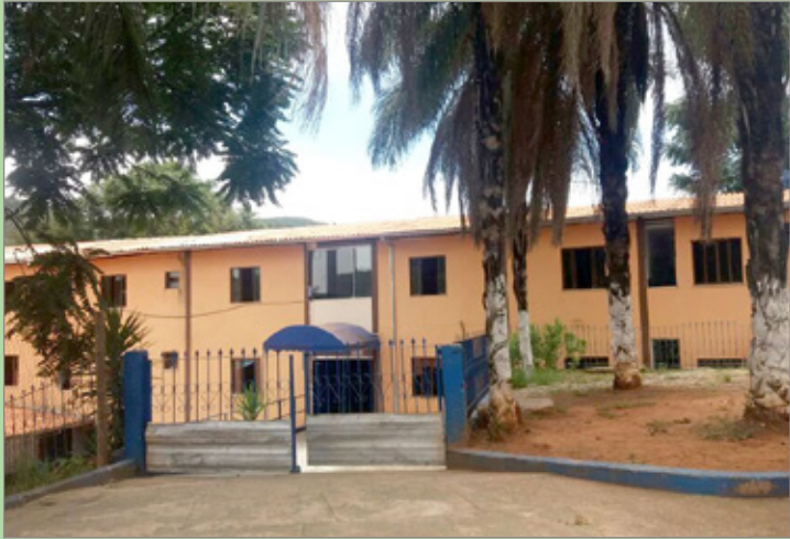
Além do alojamento, uma das estruturas conta com prédio industrial onde irão funcionar cursos de capacitação

Centro de Valorização pela Vida Maria Reis é iniciativa da diretoria das Obras Sociais da Paróquia da Boa Viagem e é gratuito