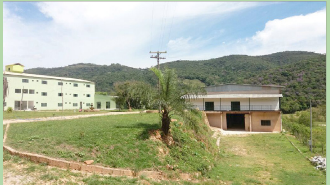
Em fase final, ao todo a casa oferece 28 suítes