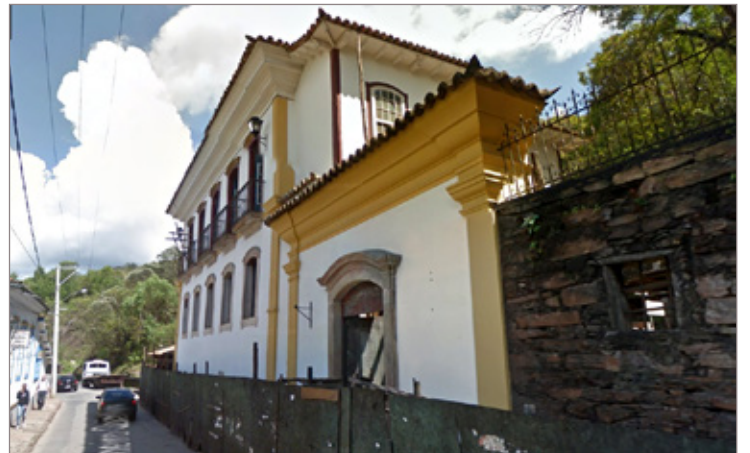
Reforma do Casarão da Rua Quintiliano tramita na Justiça

Quando as notificações e todas as ações administrativas cabíveis ao Iphan exaurem, é que o caso