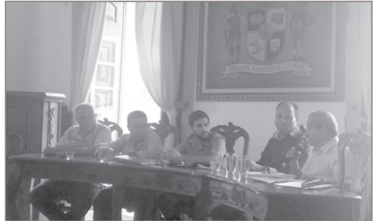
Vereador pede transparência do executivo na distribuição de cestas básicas