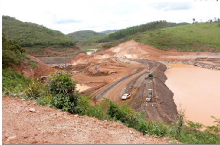
Dique S4 já está em fase avançada de construção

Os primeiros diques, S1 e S2, que já estão com a sua capacidade atingida, foram construídos ao longo do córrego de Fundão com porte menor para atender às necessidades ainda no pico do primeiro período chuvoso, em janeiro deste ano. O dique S3 já foi construído com uma estrutura mais robusta e maior e atualmente passa por obras de alteamento para ampliar sua capacidade. Já o S4 está em andamento, assim como a construção da barragem de Nova San-