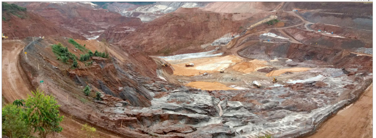
Cava Sul Alegria, local que a Samarco quer depositar rejeito após extrair restante do minério

tarém. Paralelamente à construção dessas estruturas emergenciais, a Samarco continua com o trabalho de recuperação dos diques de Sela, Selinha e Tulipa, localizados logo à frente da barragem de Germano.