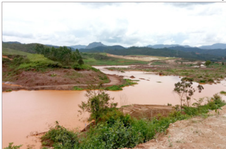
Ao fundo o que sobrou de Bento Rodrigues, que está bem próximo do dique S4