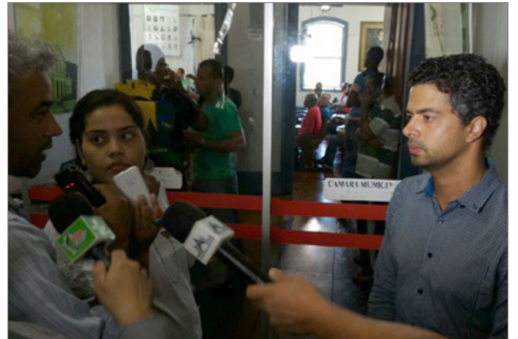
Secretário de Fazenda concede entrevista à imprensa após participar da reunião da câmara de vereadores