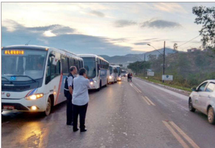
Sindicato promove paralisação pacífica contra cortes dos direitos dos trabalhadores da Vale

Uma nova pauta foi encaminhada para a próxima reunião com a Vale, que acontece nos dias 7 e 8 de novembro. O sindicato propõe: ganho real salarial e no cartão alimento e não aceita o corte dos planos odontológicos.