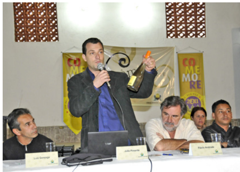
A cor da água em Cachoeira foi questionada durante a reunião dos vereadores