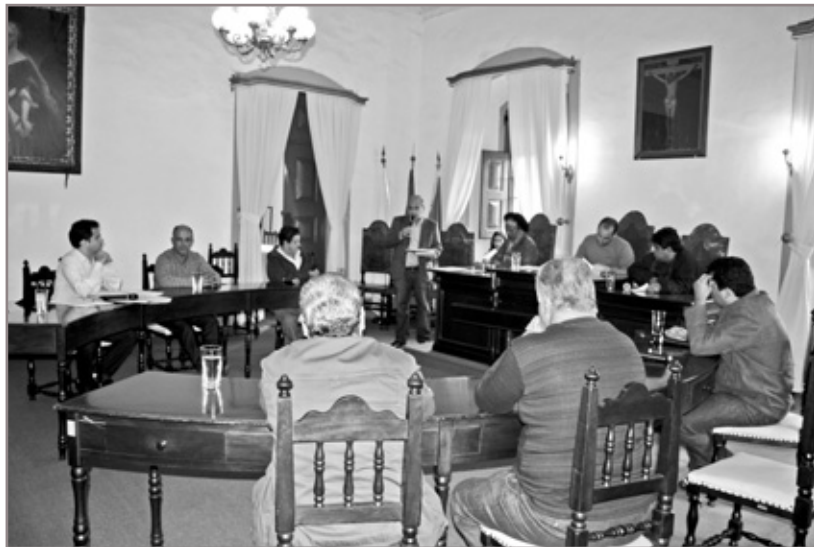
Denúncias de irregularidades na merenda levaram os vereadores a solicitar a presença do Secretário de Educação na Câmara