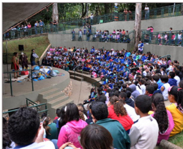
Cerca de mil crianças assistiram ao teatro sobre a preservação do meio ambiente