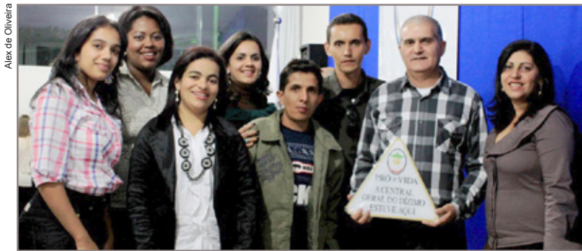
No último dia 10, o Hospital Monsenhor Horta – São Camilo - foi contemplado pela Pró-Vida, entidade civil sem finalidade lucrativa, com a doação de equipamentos médicos e hospitalares, a partir de solicitação pelo próprio hospital à Central do Dízimo de Varginha. Entre os materiais e equipamentos doados, estavam monitor multiparâmetro, camas, poltronas, mesas de cabeceiras e suportes de soro