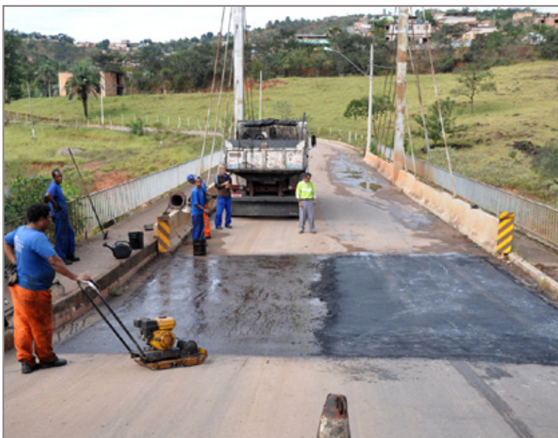
A obra vai beneficiar os moradores dos bairros Padre Adelmo e Padre Eustáquio

O uso de chás como camomila e hortelã atuam melhorando as irritações e fluidificando o muco.