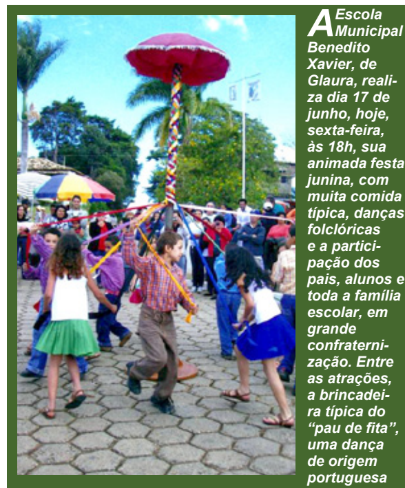
A Escola Municipal Benedito Xavier, de Glaura, realiza dia 17 de junho, hoje, sexta-feira, às 18h, sua animada festa junina, com muita comida típica, danças folclóricas e a participação dos pais, alunos e toda a família escolar, em grande confraternização. Entre as atrações, a brincadeira típica do "pau de fita", uma dança de origem portuguesa