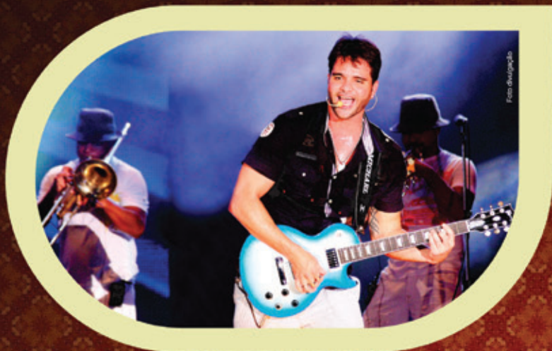
22h Show com A Zorra