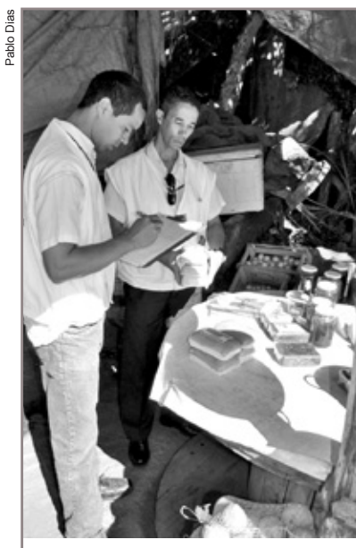
Equipe da Vigilância Sanitária verificou a presença de produtos estragados e sem registro

A Prefeitura de Itabirito foi informada de casos de intoxicação de moradores de Ouro Preto, que, após ingerir o caldo de cana na quinta-feira, dia 16, tiveram que ser hospitalizados. A Prefeitura já havia notificado o proprietário por três vezes (em 29 de março de 2010 e em 02 e 28 de fevereiro de 2011), pela falta de alvará de funcionamento e localização. "O local estava totalmente irregular, já que a estrutura era totalmente improvisada e não havia a permissão do DNIT