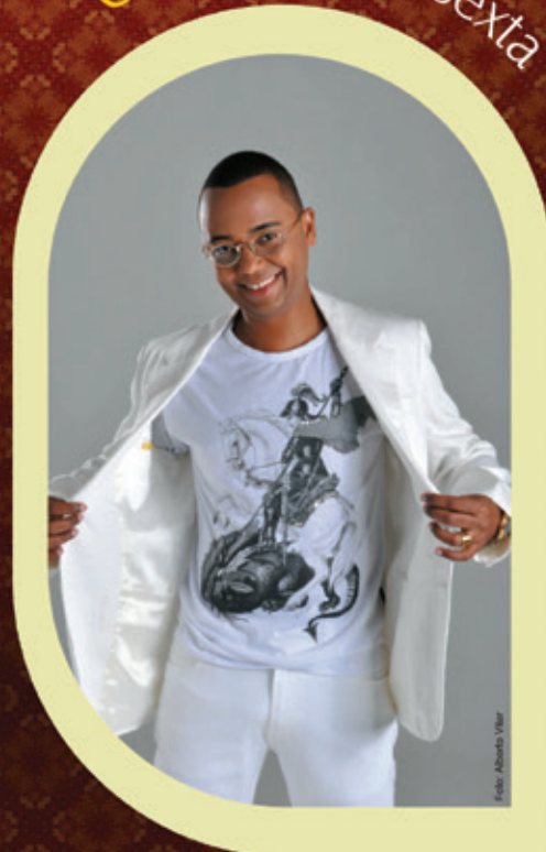
22h Show com Dudu Nobre