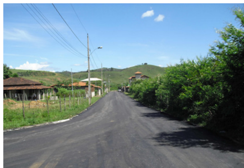
Asfalto dentro de Bandeirantes

As obras em Mariana não param e estão beneficiando, além da sede do município, vários distritos. Um exemplo é Bandeirantes. O distrito passou por uma revitalização em sua pavimentação, que percorreu desde sua entrada até diversas ruas em toda a localidade.