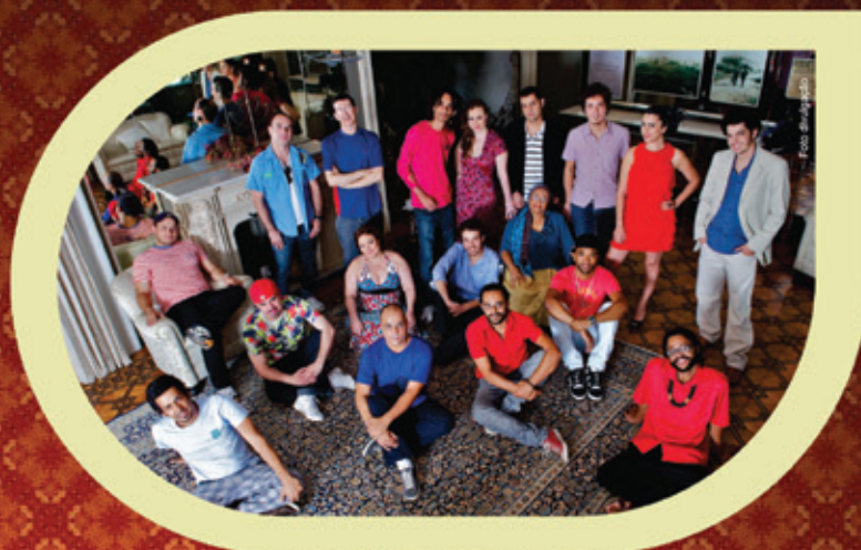
21h Show com Orquestra Cabaré