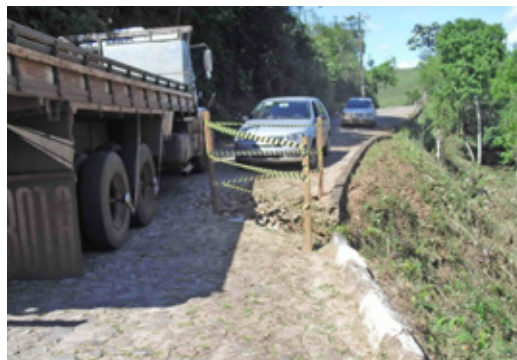
Situação da estrada antes do Gabião em Bandeirantes