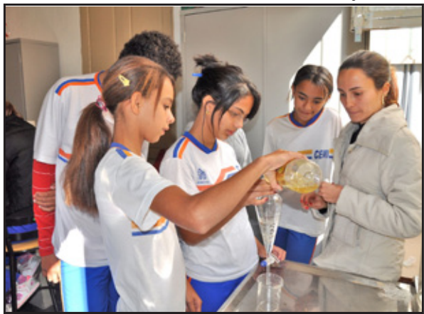
Investimentos colaboram com a melhoria das aulas práticas oferecidas aos alunos