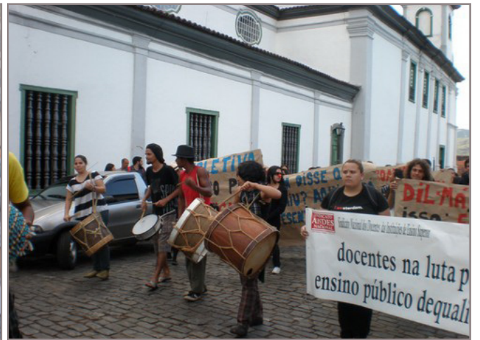
Insatisfação de alunos e professores da UFOP desencadeou manifestações em Ouro Preto e Mariana

Nas duas últimas semanas Ouro Preto e Mariana protagonizaram manifestações e passeatas de estudantes da Universidade Federal de Ouro Preto (Ufop). Sob a bandeira da qualidade do ensino superior, o movimento repudiou os rumos da educação na instituição, e do ensino público no Brasil. Na tarde de terça-feira, 21, alunos do Departamento de Música (Demus) e de Arte (Deart) protestaram na Praça Tiradentes, ruas centrais de Ouro Preto e se concentraram nas proximidades da Reitoria. Nos dias 14 e 15, em Mariana, parte do corpo discente e Centros Acadêmicos do Instituto de Ciências Humanas e Sociais (Ichs) e Instituto de Ciências So-