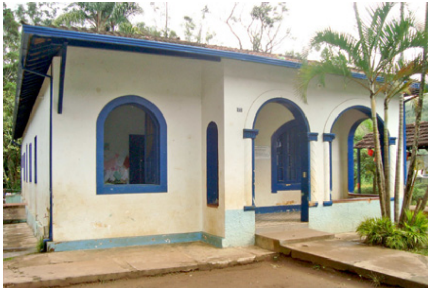
Casa Lar abriga dezenas de crianças e adolescentes em situação de risco social, embora legislação e condições da instituição não permitam