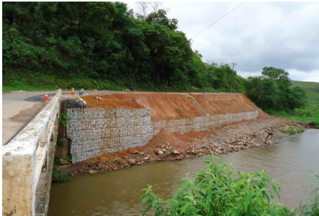
Obra do gabião concluída em Bandeirantes