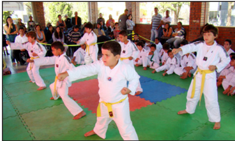
Atletas participaram do Dia das Artes Marciais, realizado na Praça da Estação