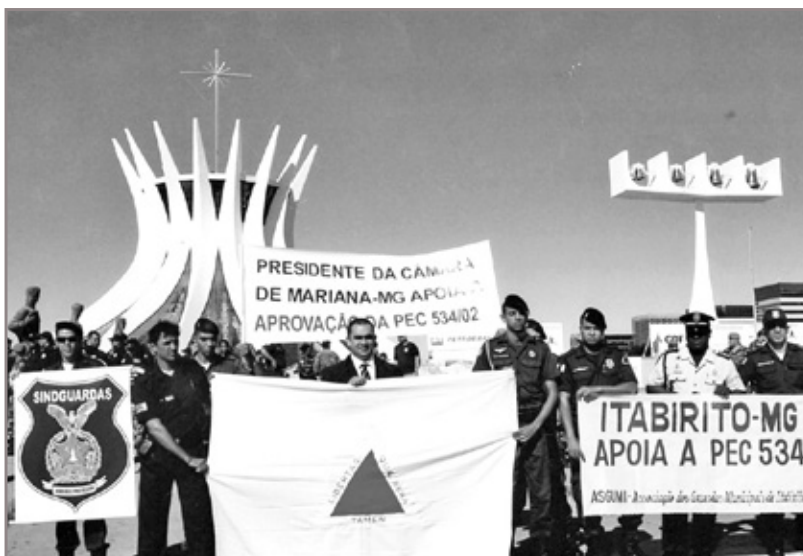
Guarda Municipal de Itabirito participou da marcha, que reuniu mais de 3 mil profissionais