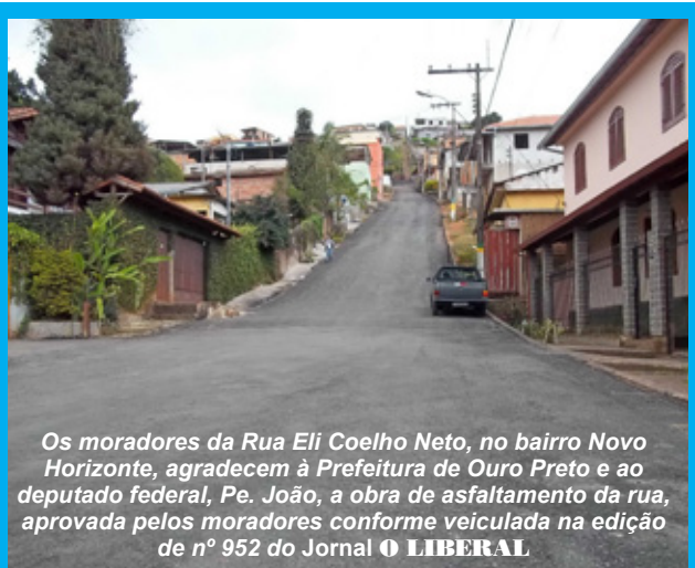
Os moradores da Rua Eli Coelho Neto, no bairro Novo Horizonte, agradecem à Prefeitura de Ouro Preto e ao deputado federal, Pe. João, a obra de asfaltamento da rua, aprovada pelos moradores conforme veiculada na edição de nº 952 do Jornal O LIBERAL

CHÁCARAS de 1000 m² e 2000 m² no Condomínio Paragem do Tripuí. Ótimos preços. Oportunidade! Tratar: (31) 8784-2240