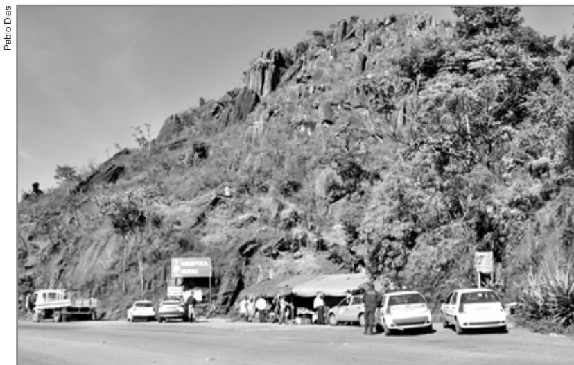
Estabelecimento já havia sido notificado pela Prefeitura de Itabirito por três vezes