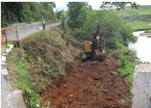
Início das obras do gabião