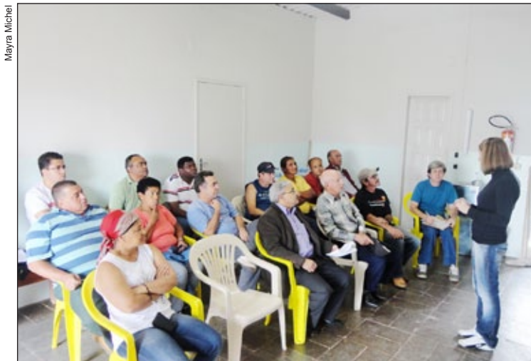
População está tendo a oportunidade de propor ações pelo saneamento básico

Divididas em quatro eixos temáticos: Água, Esgoto, Resíduos Sólidos e Drenagem Pluvial, nas reuniões estão