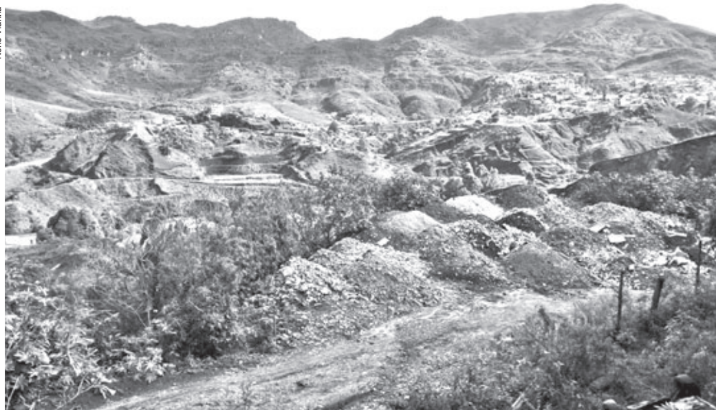
Área licenciada para receber entulhos de construção civil no bairro Santa Cruz 2