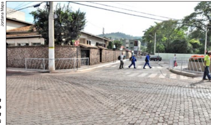
Barreiras instaladas pela Prefeitura de Itabirito garantem a segurança dos pedestres

De acordo com o secretário, a barreira foi instalada onde havia um acesso aos portadores de necessidades especiais, “mas já estamos providenciando a construção de uma nova rampa”. “Funcionários da Prefeitura já estão estudando um novo local para o rebaixamento do meio fio, em largura suficiente para a passagem de uma cadeira de rodas”, encerra Anísio.