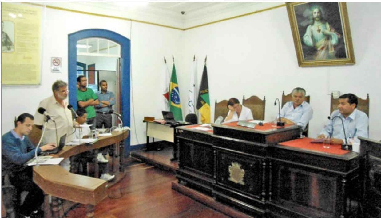
Comunidade e poder público se unem para resolver impasse entre moradores e repúblicas estudantis

As associações de Moradores da Bauxita e os vereadores de Ouro Preto querem medidas mais rigorosas para coibir excessos em festas das repúblicas estudantis de Ouro Preto. Durante a reunião ordinária de terça-feira, 22, a Câmara Municipal chegou a discutir a possibilidade de elaborar um projeto de lei com questões centrais e polêmicas em torno dos problemas e impasses entre estudantes e moradores. O assunto também foi destaque na segunda-feira, 21, quando a comunidade lotou a sede do Pró-Melhoramentos, na Bauxita, para relatarem suas queixas.