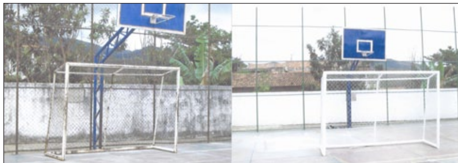
Compare as melhorias na Quadra Poliesportiva do Bairro São Pedro