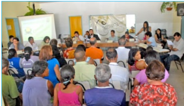
Com a realização da Câmara Itinerante em Rodrigo Silva, o Programa contemplará os 12 distritos ouro-pretanos