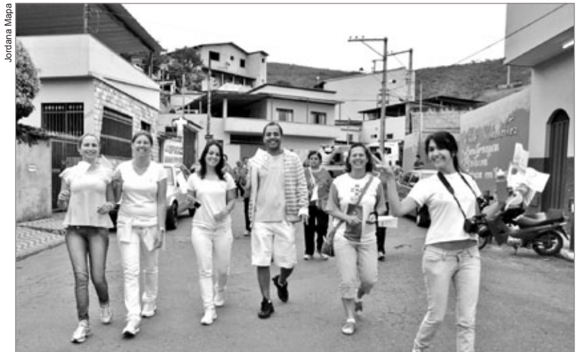
Profissionais da Uaps do bairro Vila Gonçalo acompanharam a caminhada, oferecendo segurança aos participantes

Um dos destaques da programação foi a caminhada organizada pela Uaps do Vila Gonçalo, na manhã do dia 18, saindo da unidade de saúde até o Parque Ecológico. A iniciativa foi fortalecida pela participação dos integrantes do grupo Mexa-se e da população em geral. Segundo a técnica em enfermagem