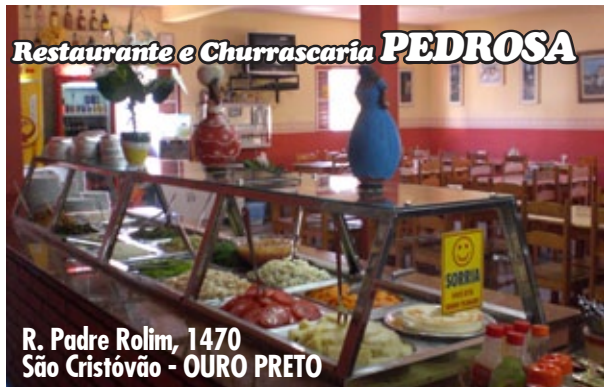
R. Padre Rolim, 1470 São Cristóvão - OURO PRETO

A Prefeitura de Ouro Preto, por meio do Departamento de Vigilância em Saúde da Secretaria de Saúde, informa que não existem registros de casos de raiva em cães e gatos no município. Entretanto, há notificações da doença em equinos e bovinos. Esse fato reforça a extrema importância da vacinação, pelos produtores rurais e criadores, dessas espécies de animais. A raiva é uma doença causada por vírus que se alastra pelo sistema nervoso de animais domésticos e selvagens como cães, gatos, macacos, morcegos, incluindo o homem. Ela é transmitida pela saliva do animal contaminado através de lesão da pele do novo hospedeiro. Havendo caso de agressão por esses animais, o Ministério da Saúde recomenda lavar o ferimento com água e sabão, procurar assistência médica e entrar em contato com as autoridades de Saúde locais. A campanha de vacinação antirrábica, que acontece anualmente em agosto, encontra-se suspensa por tempo indeterminado, segundo nota técnica divulgada pelo Ministério da Saúde. Outras informações no setor de Zoonoses da Prefeitura de Ouro Preto pelo telefone 3559 3250.