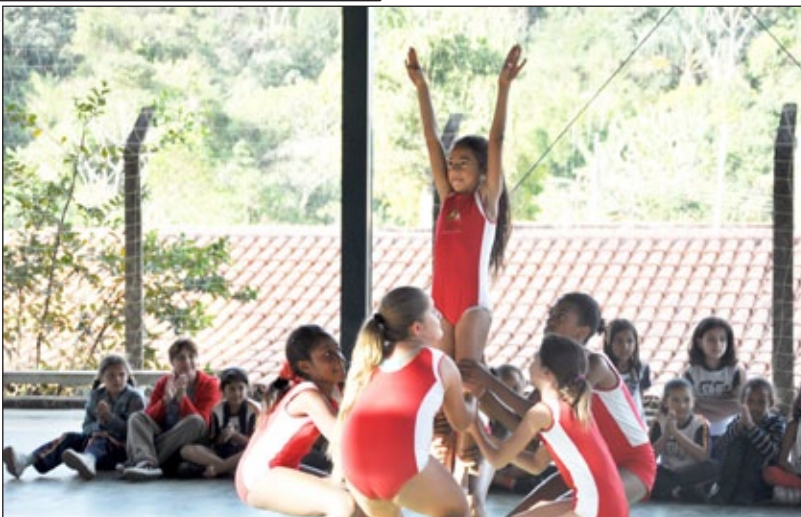
Apresentação de ginástica artística, feita pelos alunos da Prefeitura de Itabirito, promete encantar o público