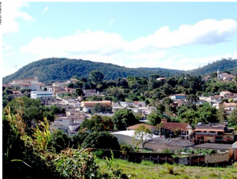
Igreja de Nossa Senhora de Nazaré à direita e a de Nossa Senhora das Dores à esquerda em Cachoeira do Campo

A unidade de atendimento da Secretaria de Patrimônio e Desenvolvimento Urbano atende demandas de regulação urbana, além de fiscalização de obras e posturas. Já a da Secretaria de Agropecuária recebe solicitações como manutenção de estradas de terra para escoamento da produção rural, pedidos de legitimação de posse entre outros.