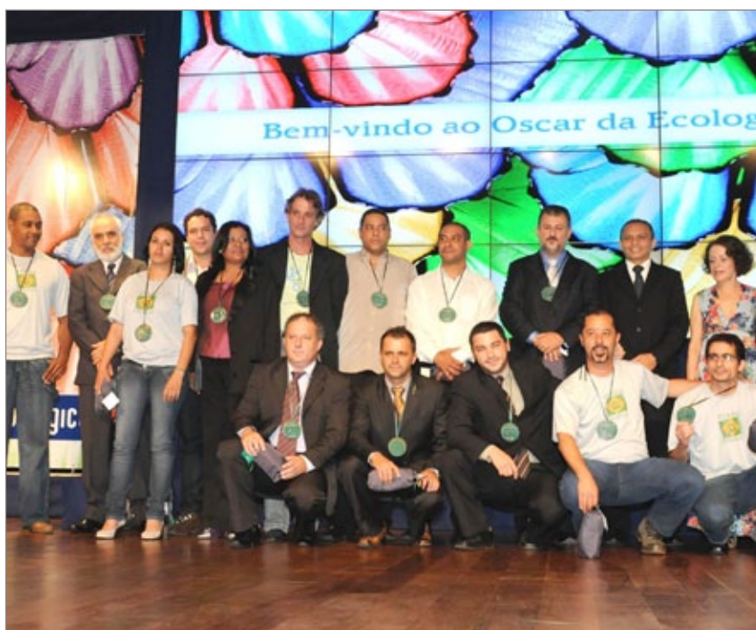
Homenagem aos brigadistas em Belo Horizonte