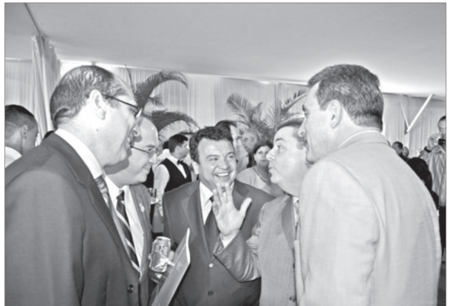
O deputado estadual Alencar da Silveira conversa com o governador Antônio Anastasia no lançamento da pedra fundamental da Fábrica Coca-Cola Femsa, em Itabirito, na última segunda-feira, dia 5 de dezembro

No dia 18 próximo, 13h, no Ginásio Poliesportivo Pedro Cardoso, em Itabirito, serão entregues certificados dos cursos de Qualificação Profissional, relativo ao segundo semestre deste ano. Os cursos são proporcionados pelo Núcleo de Assistência à Juventude / Prefeitura Municipal de Itabirito.