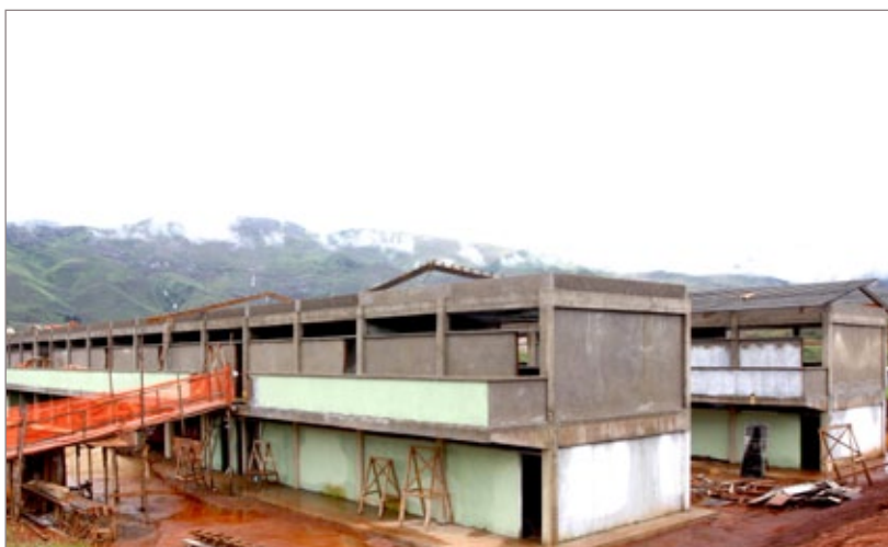
Escola em Antônio Pereira englobará dois prédios com salas de aula, diretoria, orientação educacional, biblioteca, laboratório de informática e de ciências, além de central de línguas, refeitório e quadra esportiva