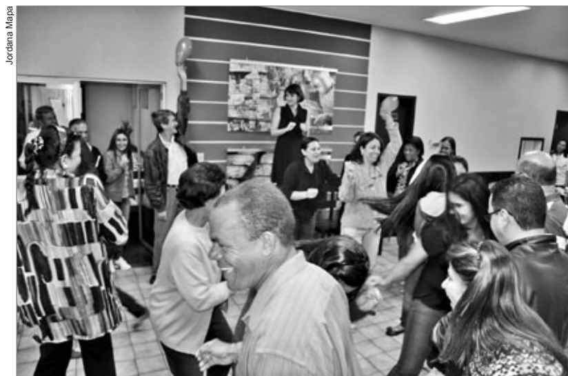
A dinâmica conciliou participantes na compreensão do tema