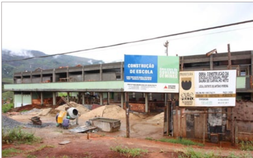
Construção da Escola Estadual Prof. Daura de Carvalho Neto, em Antônio Pereira, já está bastante adiantada

Obras da Escola Estadual Prof. Daura de Carvalho Neto estão adiantadas e contam com contrapartida da Prefeitura de cerca de R$300 mil