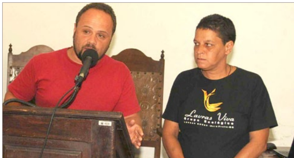
Familiares das vítimas foram à Câmara pedir atenção sobre a questão da segurança no trânsito