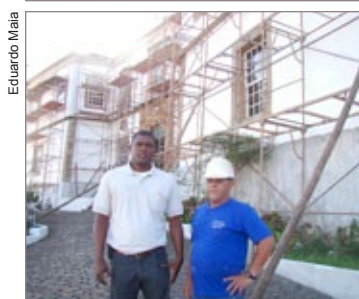
Ação valoriza um dos mais importantes monumentos históricos de Ouro Preto

para análise e aprovação da Secretaria Municipal de Patrimônio e Desenvolvimento Urbano e do Instituto do Patrimônio Histórico e Artístico Nacional (Iphan), executando-o em parceria com a iniciativa privada.