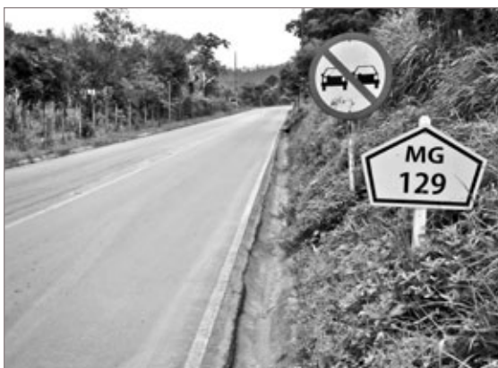
Trecho da rodovia MG-129