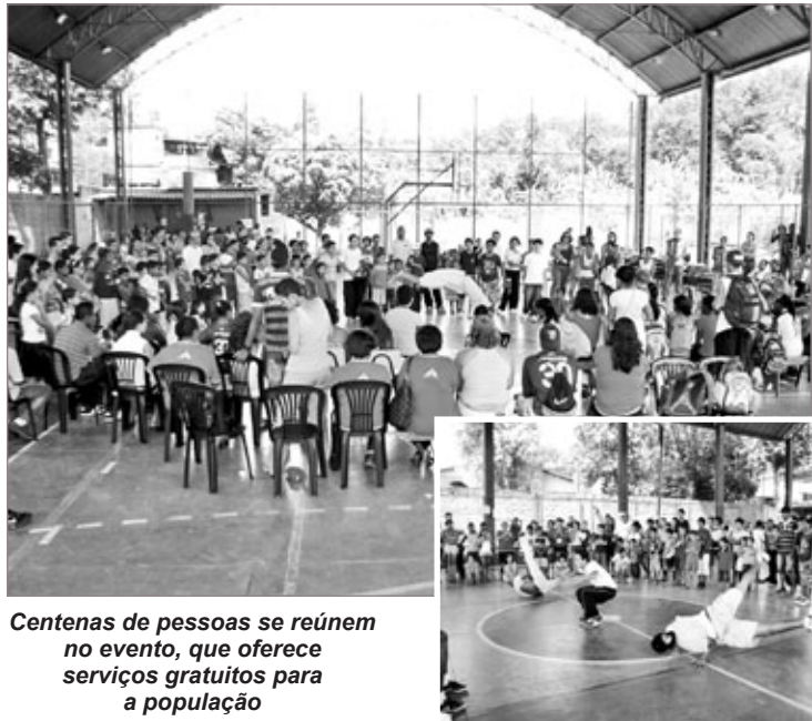
Centenas de pessoas se reúnem no evento, que oferece serviços gratuitos para a população