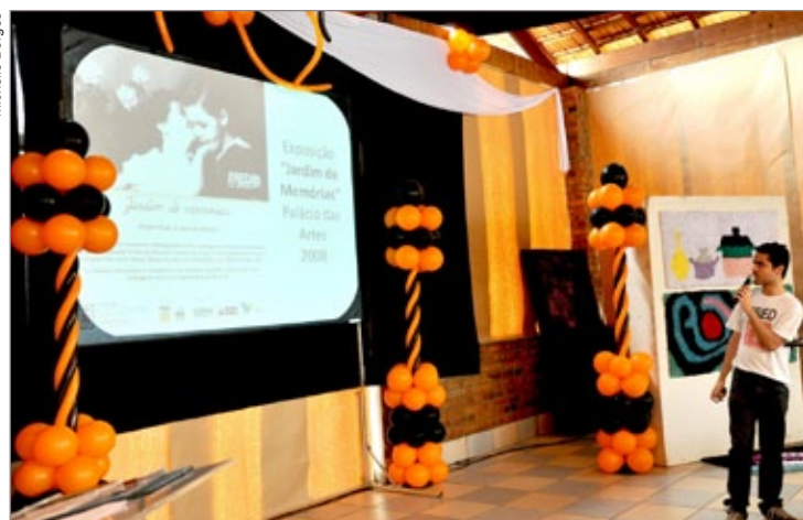
Participantes acompanharam as exposições já realizadas com os produtos do projeto