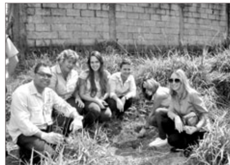
Equipes do SAAE e da Vale participaram no plantio