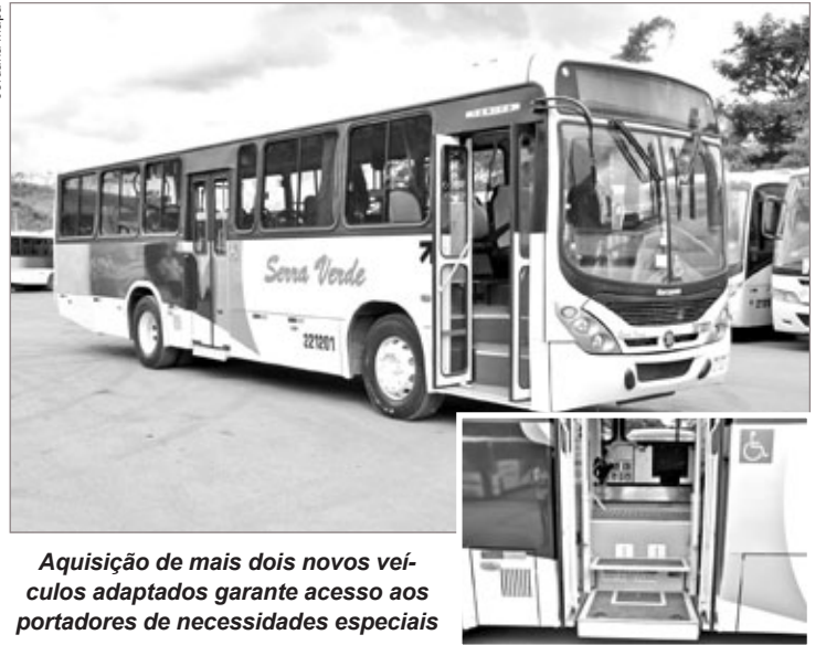
Aquisição de mais dois novos veículos adaptados garante acesso aos portadores de necessidades especiais

normas estabelecidas pelo Conselho Nacional de Trânsito, e os motoristas e cobradores já receberam treinamento para operação dos equipamentos e auxílio aos passageiros.