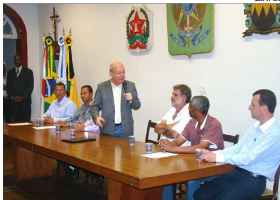
Cerimônia marca a desincompatibilização dos ex-secretários

E-mail: thaty_modas@hotmail.com www.thatymodas.com