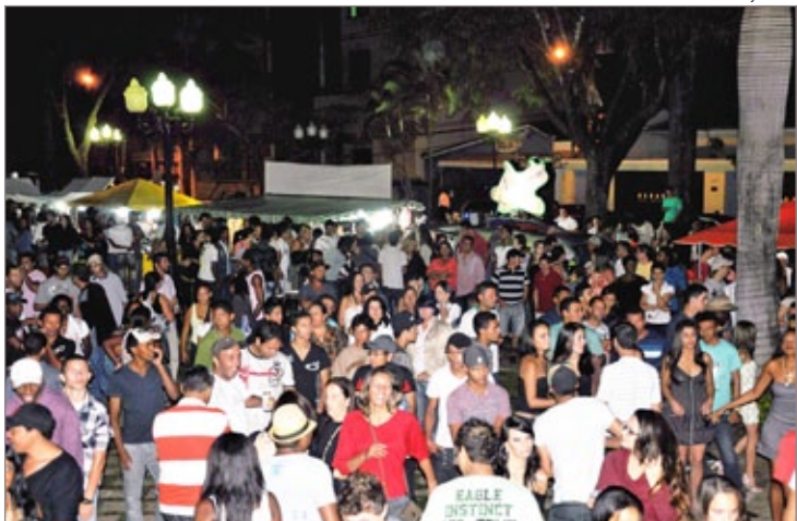
Centenas de pessoas conferiram a festa promovida pela Prefeitura