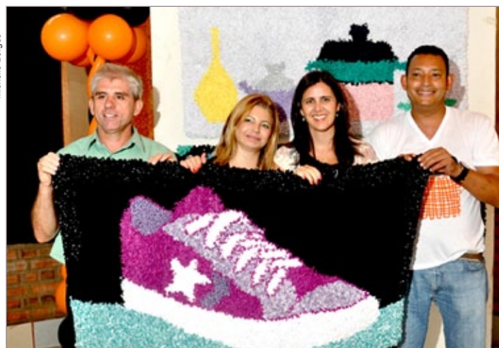
Trama Sem Nó é a técnica utilizada para produção dos tapetes