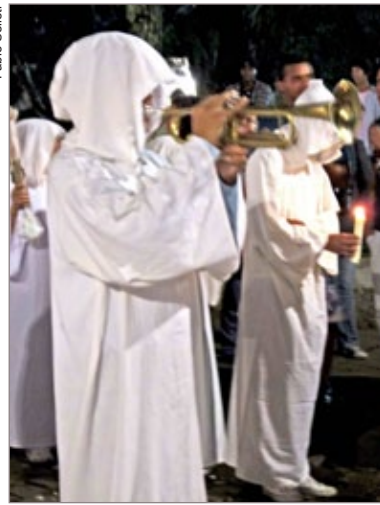
Membro da União XV de Novembro