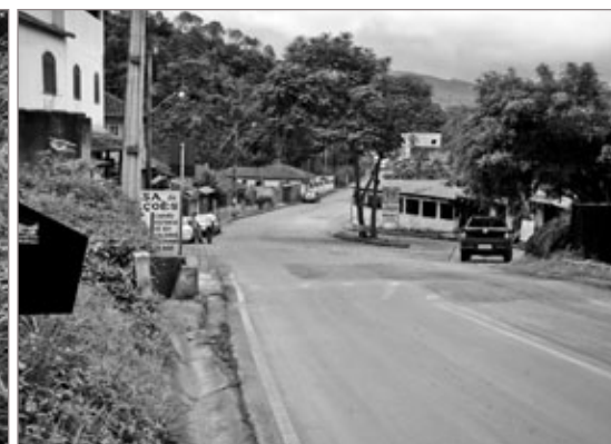
Final da rodovia MG-129 e início da Avenida Américo Renné Giannetti