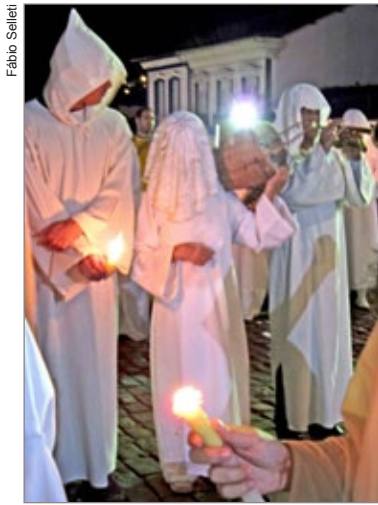
A mulher do balaio de penas