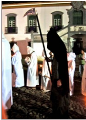
As almas e a morte