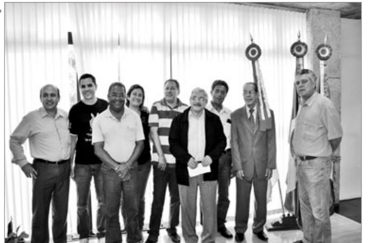
Conpatri é formado por representantes das entidades civis e do poder público

ciar as ações de preservação e conservação do patrimônio público, como a restauração de bens ou conjuntos arquitetônicos, sejam estes tombados ou inventariados pelo município.