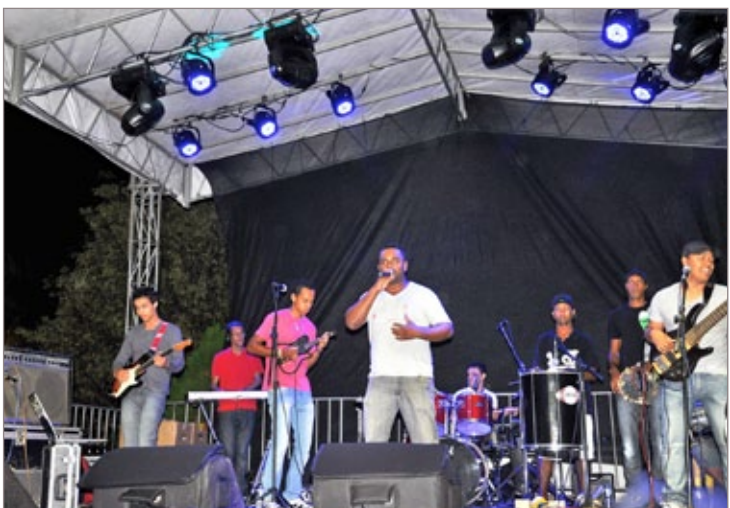
Banda SambUai agitou o público com o melhor do Axé, Pop Rock e Rock